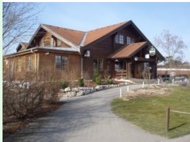
Das Clubhaus des GC Schönfeld

März 2011 - Rund eine halbe Autostunde nordöstlich von Wien liegt der kleine Ort Schönfeld im Marchfeld in der Gemeinde Lassee ca. zehn Kilometer südöstlich der Bezirksstadt Gänserndorf und weniger als zehn Kilometer von der slowakischen Grenze entfernt.