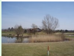
Loch 9 (Par 4, 345m) mit Teich

Die Driving Range liegt etwas weg vom Schuss - man überquert zuerst die Zufahrtsstraße und dann einen Waldstreifen. Nach ca. 3 Minuten hat man aber sein Ziel erreicht. Nach dem Aufwärmen geht's wieder zurück, Tee 1 befindet sich gleich neben dem Clubhaus.