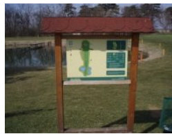
Infotafel in Schönfeld

Out-of-Bounds. Das Loch bildet den südlichen Rand des Golfplatzes, Sie haben jetzt die Nord-Süd Diagonale des Platzes gespielt. Loch 4 (Par 5, 482m) bringt sie entlang der Südwestseite des Areals (Achtung: links ist Out-of-Bounds!) zurück zu Loch 5 welches für mich das schönste am Platz ist. Ein Par 4 Dogleg rechts (292m) mit einem Teich inklusive Halbinsel-Biotop im Knie. Zusätzlich herausfordernd: links beim Grün ist Out-of-Bounds. Für mich ist Loch 5 das Signature-Hole in Schönfeld. Zwischen Grün 5 und Tee 6 liegt die