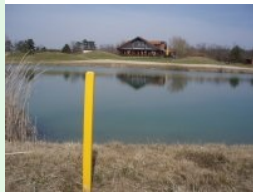
Teich bei Loch 18 (Par 4, 345m)

Im Marchfeld nordöstlich von Wien liegt die 18+9 Loch Anlage des Golfclubs Schönfeld. Der Platz ist - obwohl erst Ende März - schon in einem relativ guten Zustand und auch erstaunlich gut ausgelastet. Was auffällt sind die vielen Golfer aus der benachbarten Slowakei. Der Platz an sich ist eher unspektakulär aber trotzdem golferisch herausfordernd. Auf der Homepage fehlt eine Übersicht über die gesamte Anlage - es werden lediglich die einzelnen Löcher ("Birdiebook") beschrieben.