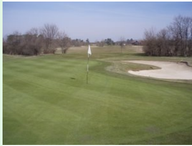
Grün Loch 10 (Par 4, 331m)

Halfway Station in Schönfeld. Ein an sich hübsches Holzhäuschen - was allerdings stört ist das mobile WC hinter dem Häuschen. Das ist wahrscheinlich praktisch - aber sicher nicht gut fürs Auge. Das Grün von Loch 6 (Par 3, 157m) liegt auch an dem vorher beschriebenen Teich, hier dürfen Sie sich beim Anschlag keinen Slice erlauben sonst landet der Ball im Wasser oder bestenfalls im langgezogenen Bunker zwischen Teich und Grün. Nach Loch 7 kommt mit Loch 8 (Par 4, 380m) ein wunderschönes Dogleg rechts, bei dem erschwerend hinzu kommt, dass ein Windschutzgürtel in Form einer Allee direkt auf Höhe des Knies das Fairway kreuzt. Sie müssen den Teeshot also relativ genau platzieren damit sie mit dem zweiten Schlag durch das "Fenster" im