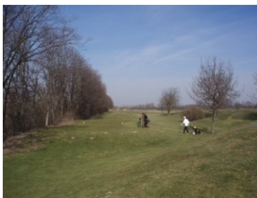
Abschlag Loch 4 (Par 5, 482m)

slowakische Kennzeichen haben. Auf Grund der Nähe der Staatsgrenze kommen sehr viele Gäste aus der Slowakei, dies ist hier ebenso wie im 20 km entfernten Golfclub Hainburg. Die Infrastruktur ist eher einfach gehalten. Im vorderen Teil des Clubhauses liegt das Sekretariat, dahinter dann das Restaurant mit einer schönen Terrasse. Die Dame im Sekretariat ist sehr freundlich, auch der Kellner, der mir den Cafe vor der Runde serviert, ist gut drauf.