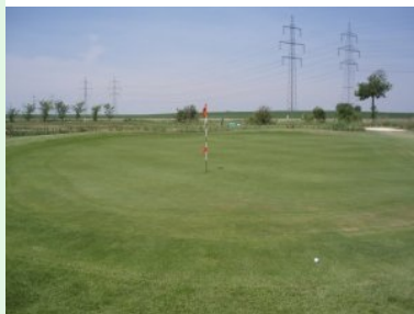
Grün Loch 2 (Par 5, 398m)

Am Weg zum ersten Abschlag überquert man die Landesstraße. Loch 1 (Par 4, 350 m von gelb) ist ein gemütliches Eröffnungsloch. Der Abschlag liegt erhöht gleich neben der Landesstraße, weit rechts Richtung Straße ist Out-of-Bounds, zwei Fairwaybunker und zwei Grünbunker warten auf die Bälle. Nehmen sie hier ihren Driver vom Tee, die Landezone ist breit genug. Das gilt übrigens für fast alle Par 4 und Par 5 Löcher in Spillern. Loch 2 (Par 5, 398m) ist ein kurzes Par 5 Dogleg rechts. Die Landezone liegt leicht erhöht auf einer Kuppe, der