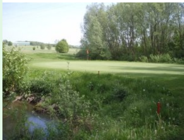
Grün Loch 12 (Par 3, 129m)

(317m) und Loch 6 (291m) ehe es dann mit Loch 7 (Par 5, 479m), einem Dogleg rechts, wieder ordentlich lang wird. Zwischen Grün 7 und Tee 8 quert man das erste Mal das Bacherl und den Windschutzgürtel. Loch 8 (Par 3, 156m) führt leicht bergauf aus einer Waldschneise im Windschutzgürtel raus aufs Grün das wieder im freien Gelände liegt. Loch 9 (Par 4, 345m) ist ein leichtes Doppeldogleg, dessen Grün gleich links und rechts von kleinen Teichen verteidigt wird.