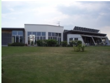
Das Clubhaus des GC Spillern

Mai 2011 - Rund 25 km nordwestlich von Wien oder 15 Autominuten von der Stadtgrenze von Wien entfernt liegt die Gemeinde Spillern im Bezirk Korneuburg im Weinviertel zwischen den Städten Korneuburg und Stockerau.