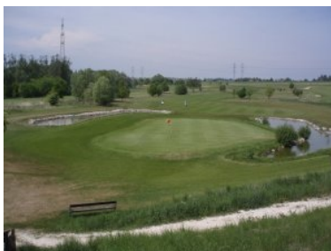
Grün Loch 9 (Par 4, 345m)

Loch 3 (Par 4, 308m) ist ein Dogleg nach rechts, eines der schönsten Löcher in Spillern und formal das schwierigste Loch (Index = 1). Der Teeshot muss gerade sein - links ist Wald und rechts stellt eine Baumfläche die Grenze zu Grün 4 dar. Der Abschlag sollte nicht zu kurz sein, weil dann die Bäume im Knie im Weg sind und sie das leicht erhöhte Grün nicht direkt anspielen können. Zu lange sollte der Abschlag aber auch nicht sein weil der Ball dann im Wald links vom Knie (seitliches Wasserhindernis) landet. Zwei Bunker verteidigen das Grün.