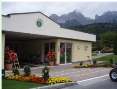
Das Clubhaus des GC Urslautal

Der Platz liegt im offenen Gelände und ist in einem guten Pflegezustand. Von der Topologie her ist er relativ flach und so designt dass man nach den Front-Nine wieder zum Clubhaus zurück kommt.