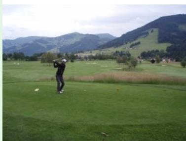
Loch 9 (Par 4, 367m)