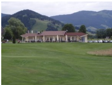
Das Clubhaus mit Terrasse von Loch 18 aus gesehen

Rund 70 km südlich der Stadt Salzburg liegt die 18+3 Loch Anlage des Golfclubs Urslautal zwischen Saalfelden und Maria Alm im Pinzgau. Der 18 Loch Platz liegt wunderschön am Fuße des Steinernen Meeres, er ist leicht hügelig und liegt im offenen Gelände. Bunker, Wasser, Waldstreifen und das hohe Rough machen den Platz golferisch anspruchsvoll.