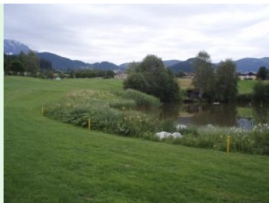
Loch 18 (Par 5, 495m)

hier - wie überall am Platz - extrem hoch. Das Grün von Loch 15 (Par 3, 161m) wird gleich von drei Bunkern verteidigt. Loch 16 (Par 5, 449m) ist ein Dogleg nach rechts, im Knie liegt der vorher beschriebene Teich mit der Insel, weiter vorne noch ein kleiner Teich. Vorne am Grün ist links ein Biotop, rechts sind zwei Bunker gut platziert. Nach Loch 17 (Par 3, 164m) bringt Sie Loch 18 (Par 5, 495m) wieder zurück zum Clubhaus. Es ist das längste Loch am Platz und führt ständig bergauf Richtung Clubhaus - es ist ein gebührendes Finalloch für diese gelungene Golfanlage. Gönnen Sie sich danach was Gutes auf der Clubhausterrasse und lassen Sie sich nochmals vom umliegenden Panorama bezaubern.