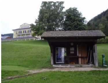
Starthütte mit Sheraton Hotel im Hintergrund

Der 9-Loch Golfplatz liegt auf einem Nordhang unterhalb des Clubhauses im Restaurant Jagdhof und erstreckt sich bis hinunter zum See, Loch 7 an der tiefsten Stelle des Platzes liegt direkt am Fuschlsee. Schloss Fuschl liegt knapp oberhalb von Loch 7 aber nicht direkt am Platz.