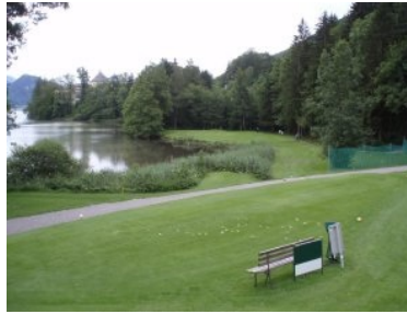
Loch 7 (Par 3, 121m); links hinten sieht man einen Turm von Schloss Fuschl

querliegenden frontalen Sandbunker verteidigt wird. Im großen Bunker gibt es zwei grüne Inseln. Loch 5 (Par 3, 187m) geht leicht bergauf, der Schlag aufs Grün - sei es der erste oder der zweite Schlag - erfolgt blind weil das Grün hinter einer Kuppe liegt. Loch 6 (Par 4, 247m) führt flach entlang einer Baumreihe links die die Grenze zum See darstellt. Loch 7 (Par 3, 121m) ist das Signature Hole in Fuschl - es führt von einem erhöhten Grün über einen öffentlichen