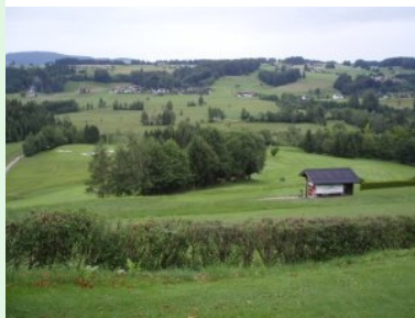
Blick über die Anlage

Die 9-Loch Anlage des Romantikcourses Fuschl gehört zum Golfclub Salzburg und liegt auf einem Nordhang am Westufer des Fuschlsees in der Gemeinde Hof bei Salzburg. Der Golfplatz lebt von seiner Lage oberhalb und am Fuschlsee und der damit verbundenen herrlichen Aussicht auf den Fuschlsee und die Umgebung. Vom Design her ist der Platz nicht optimal aufgestellt. Das Kreuzen des