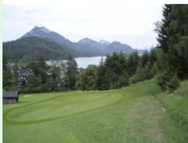
Grün Loch 1 (Par 3, 126m) mit Schloss Fuschl (rechts hinter den Bäumen)

Der Weg zu Tee 1 führt bergab über das Fairway von Loch 2 (Achtung!). Wundern Sie sich nicht wenn vor der Starthütte herrenlose Bags und Trolleys herumstehen - es wird hier (per Tafel) empfohlen die Bags bei Tee 1 stehen zu lassen und erst nach dem Abschlag von Loch 2 wieder abzuholen weil der Weg dazwischen mühsam ist (zuerst steil bergab auf Grün 1 und dann steil bergauf zu Tee 2).