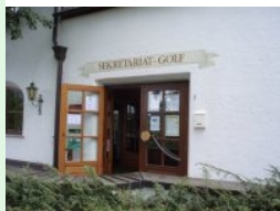
Das Clubsekretariat im Restaurant Jagdhof

Juni 2011 - Rund 20 km östlich der Stadt Salzburg liegt der Fuschlsee. Der 9-Loch Golfplatz Romantikcourse Fuschl liegt am westlichen Ende des Sees in der Gemeinde Hof bei Salzburg. Das Clubhaus des Golfplatzes ist im Restaurant/Hotel Jagdhof untergebracht, dieses liegt benachbart zum Sheraton Fuschlsee an der Wolfgangsee-Bundesstraße zwischen Hof bei Salzburg und der an der Ostseite des Sees liegenden Gemeinde Fuschl am See. Und weil gerade von den Hotels die Rede ist: Das noble Schloss Fuschl ist auch nicht weit entfernt, man fährt vom Sheraton Hotel noch einige hundert Meter die Zufahrtsstraße hinunter, passiert einen Schranken und schon blickt man auf das wunderschön renovierte Schloss Fuschl das direkt oberhalb des Sees liegt. Alle drei genannten Hotels gehören zusammen (Schloss Fuschl Betriebe), auch Schloss Pichlarn im steirischen Ennstal gehört dazu.