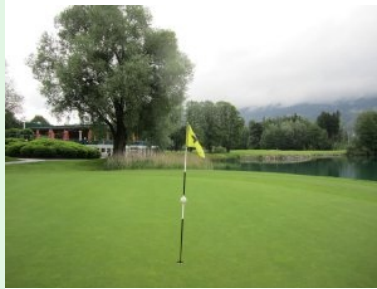
Grün Loch 9 mit Clubhaus und Drachensee

Loch 10 (Par 4, 295m) ist ein leichtes Dogleg rechts vor dem Clubhaus. Loch 11 (Par 5, 524m), Loch 12 (Par 4, 376m) und Loch 13 (Par 4, 364m) sind dann eher Löcher zum Durchatmen ehe es auf Loch 14 (Par 4, 330m) wieder ans Eingemachte geht. Das rechtwinkelige Dogleg links erfordert einen genauen Teeshot ins Knie (dort lauer aber ein Fairwaybunker) um mit dem zweiten Schlag das Grün anspielen zu können. Dabei führt der Annäherungsschlag über einen Bach auf das Grün das gleich von vier Sandbunkern verteidigt wird. Jetzt beginnt das furiose Finale des Golfplatzes Am Mondsee. Der Teeshot von Loch 15 (Par 3, 150m) führt über den Drachensee. Je weiter links (direkter zur Fahne) Sie spielen desto