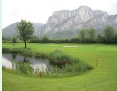
Loch 5 (Par 4, 404m) mit der Drachenwand im Hintergrund

Loch 1 (Par 4, 326m von gelb) ist ein typischer Eröffnungsloch. Mittelschwer - weil im zweiten Teil Parkland-ähnlich schmal. Loch 2 (Par 4, 314m) führt Sie wieder aus dem Wald heraus nach vorne Richtung Clubhaus. Jetzt geht es über die Zufahrtsstraße zum Tee von Loch 3 (Par 3, 156m). Loch 4 (Par 4, 377m) ist dann schon ein längeres Par 4. Loch 5 (Par 4, 404m) ist dann ein echter Test Ihrer Länge und zusätzlich kommt links vor dem Grün erstmals Wasser ins Spiel. Es ist dies das formal schwerste Loch am Platz (Index = 1). Loch 6 (Par 4, 338m) ist ein wunderschönes Loch und ein Dogleg nach rechts. Vom Tee sollten Sie hier nicht zu lange sein weil sonst das Wasser auf der linken Seite nach dem Knie zu stark ins Spiel kommt. Das Loch erfordert einen