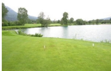
Teeshot Loch 9 (Par 5, 479m) über den See

Loch 9 (Par 5, 479m) ist ein wunderschöner Abschluss der Front-Nine. Lassen Sie sich bitte an dieser Stelle vom Routing des Platzes nicht verwirren. Der weiße Abschlag von Loch 15 geht rechts über den See und kreuzt damit die Abschläge von Loch 9, die links über den See gehen. Der Teeshot von Loch 9 erfolgt über den Drachensee (ca. 150m carry). Erschwerend kommt hinzu dass Sie entweder links oder rechts des breiten, singulären Baums am gegenüberliegenden Ufer des Sees eine "Landezone" finden müssen. Der Rest des Fairways schmiegt sich um den Drachensee, das Grün liegt weit vorne in Sichtweite der Clubhausterrasse. Kurz vor dem Grün, das sich wunderschön mit einer Steinmauer aus dem See abhebt, züngelt eine kleine Ausbuchtung des Drachensees gefährlich ins Fairway rein sodass man schon fast von einem Halbinselgrün sprechen kann. Für mich ist Loch 9 das