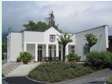
Das Clubhaus des GC Am Mondsee

Zufahrtsstraße ist stellenweise sehr eng - bei Gegenverkehr muss man schon mal anhalten und/oder in die Wiese fahren.