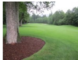
Loch 1 (Par 4, 326m)

Der gesamte Platz ist komplett flach. Viele Löcher liegen im offenen Gelände mit vereinzelt Bäumen und Büschen, die ersten beiden Bahnen und die letzten vier Löcher liegen teilweise im Wald. Die Löcher bilden zwei Schleifen um den Drachensee, der mit dem Mondsee verbunden ist. Der Golfplatz liegt zwar am Mondsee bietet aber kaum Ausblick auf den See außer punktuell an den letzten drei Löchern. Sehr schön ist das umliegende Bergpanorama mit Blick auf die Drachenwand im Süden und den Schafberg im Südwesten.