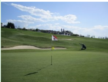
Grün Loch 5 (Par 4, 353m) mit Basilika

(Par 3, 141m) führt ebenfalls bergauf, das Grün liegt unterhalb des ersten Tees.