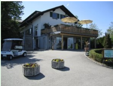
Das Clubhaus des Golfclubs Maria Taferl

Schön gelegene 9-Loch Golfanlage im südlichen Waldviertel - gleich unterhalb der bekannten Basilika von Maria Taferl