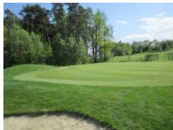
Grün Loch 4 (Par 5, 439m)

Loch 1 (Par 4, 309m von gelb) ist ein gemütliches Eröffnungsloch - es führt quer über den Hang unterhalb des Geräteschuppens schräg bergab. Die nun folgenden Löcher 2 bis 4 liegen - durch eine Landesstraße getrennt - im östlichen Teil der Anlage. Loch 2 (Par 4, 361m) liegt wunderschön am Waldrand und führt bergab, es ist ein Dogleg nach rechts. Bunker in der Landezone und vorne beim Gün lauern auf ungenaue Bälle. Loch 3 (Par 3, 150m) führt ebenfalls leicht bergab auf ein tiefgelegtes Grün das vor einem kleinen Waldstück liegt. Loch 4 (Par 5, 439m) ist das einzige Par 5 am Platz. Der Abschlag liegt zurückversetzt in dem vorher erwähnten kleinen Waldstück, der Rest der Bahn liegt - so wie der Großteil der Anlage in Maria Taferl - im freien Gelände. Da es bergauf geht zieht sich das Loch ganz schön in die Länge, das Grün liegt wunderschön am Waldrand. Über die Straße zurück geht's dann zum Tee 5. Loch 5 (Par 4, 353m) liegt unterhalb von Loch 1, es ist ein Dogleg