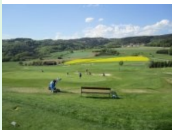
Blick über die Anlage