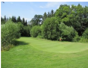
Grün Loch 4 (Par 4, 272m)

Bewässerung zu erkennen ist. Da in den Dosen allerdings sogar am Nachmittag an einem hochsommerlichen Tag noch das Wasser steht werden die Grüns bewässert. Das Wasser in den Dosen ist allerdings störend. Bälle werden bei jedem gelochten Put nass, beim Herausnehmen des Balles werden auch die Finger nass. Loch 3 (Par 4, 300m) ist ein Dogleg rechts entlang des Westgrenze des Platzes (wieder ist Out gepflockt). Wundern Sie sich nicht über die weißen, gelben und roten kugelförmigen Teeboxmarker am Fairway. Diese Teeboxmarker werden in Drosendorf auch für die Markierung von Out und Wasserhindernissen verwendet - was sehr gewöhnungsbedürftig ist. Die zweite Hälfte von Loch 4 (Par 4, 272m) liegt im Wald. Ein