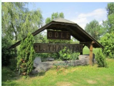
Herzlich Willkommen im GC Thayatal Drosendorf!

westlich von Drosendorf in Autendorf. Von Drosendorf ist der Golfplatz beschildert. Der Parkplatz und das Clubhaus liegen - von Drosendorf kommend - rechts oberhalb der Straße. Das Clubhaus ist ein Landgasthaus in einem neu renovierten Gebäude das früher möglicherweise ein landwirtschaftliches Gebäude war.