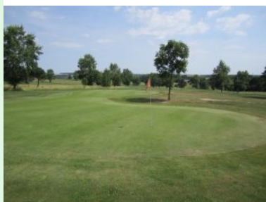
Doppelgrün Loch 2/Loch 17

Wasserhindernis vor dem Grün bzw. Wald und Wasser hinter dem Grün machen ein gutes Scoring zur Herausforderung. Das Grün liegt wunderschön am Waldrand - eine Augenweide. Loch 5 (Par 4, 304m) führt leicht bergauf durch eine engere Schneise mit Wasserhindernissen. Der Teeshot von Loch 6 (Par 4, 266m) führt entlang einer Baumreihe die das Fairway stark einengt. Zum Grün geht es leicht bergab, das Gelände öffnet sich wieder. Loch 7 (Par 3, 140m) führt durch eine Schneise über ein Wasserhindernis hinauf zu einem undulierten Grün am Waldrand. Für mich ist die das Signaturehole in Drosendorf. Die Löcher 8 und 9 (jeweils Par 4) bringen Sie dann entlang der Ostgrenze des Platzes zurück zum Clubhaus. Von hier hat man einen herrlichen Blick auf die Stadt Drosendorf mit dem Schloss und der Kirche auf dem Felsen.