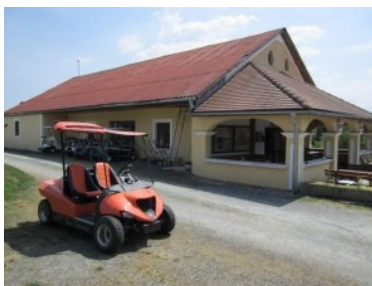
Das Clubhaus mit orangem Lamborghini Cart

Loch 1 (Par 4, 244m von gelb) ist ein schönes Eröffnungsloch. Auf Grund der Länge ist es nicht allzu schwer, allerdings ist vom Teeshot ein Biotop in einer leichten Senke zu überwinden, das aber nicht wirklich ins Spiel kommen sollte. In der Landezone ist das Fairway von Baumreihen zum Nachbarfairway hin begrenzt. Loch 2 (Par 3, 121) geht leicht bergauf, links ist Out-of-Bounds gepflockt. Das Grün bildet ein Doppelgrün mit Loch 17. Zu diesem Zeitpunkt ist auch schon klar das der Platz in Drosendorf keine Fairwaybewässerung besitzt. Nach zwei, drei hochsommerlichen Wochen ohne nennenswerten Regen sind die Fairways bräunlich dürr und knochenhart. Die Grüns sind allerdings saftig Grün obwohl keine fix installierte