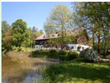
Clubhaus mit Teich