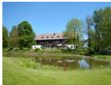
Blick von Loch 8 auf das Clubhaus

Zufahrtsstraße (zurück auf die Seite des Clubhauses). Loch 2 (Par 5, 422m) ist ein leichtes Dogleg nach links um eine Baumreihe - im Knie liegt ein großer Fairwaybunker und rechts begrenzt ein Bach das Fairway bis vor zum Grün. Loch 3 (Par 4, 390m) liegt parallel zu Loch 2 in entgegengesetzter Richtung - diesmal begrenzt der Bach rechts das Fairway. Der Annäherungsschlag weiter vorne geht dann über diesen Bach. Loch 4 (Par 3, 164m) ist ein wunderschönes, langes Par 3 das auf drei Seiten (vorne, links, rechts) von mehreren Sandbunkern verteidigt wird. Der Teeshot erfolgt durch eine Öffnung in einer Baumreihe, auch das Grün liegt in einem Eck gebildet von zwei Baumreihen. Der Teeshot von Loch 5 (Par 4, 312m) muss