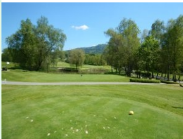
Loch 9 (Par 3, 149m) über den Teich