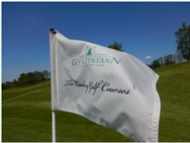
Flagge mit Logo des GC Gut Altentann