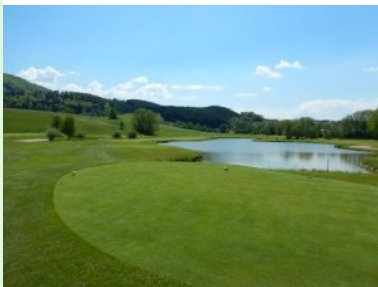
Loch 7 (Par 4, 357m)