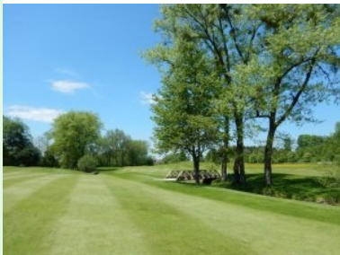
Annäherung Loch 3 mit schöner Holzbrücke