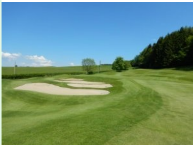
Annäherung Grün Loch 11 (Par 4, 318m)