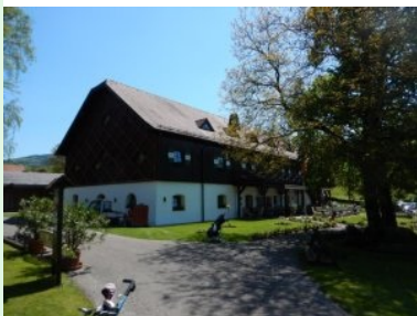
Wieder zurück beim Clubhaus