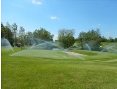
Bewässerung auf Loch 10

und Bäumen begleitet wird (Biotop), das Fairway. Auch auf Loch 7 ist das Design von Jack Nicklaus zu spüren: Eine kleine Verbreiterung der Landezone Richtung Teich bei rund 200m Entfernung von der Teebox erhöht die Chance minimal den Teeeshot nicht ins Wasser zu schlagen. Loch 8 (Par 5, 434m) ist ein Dogleg links um den vorher beschriebenen langgezogenen Sandbunker mit Biotop. Das ondulierte Grün von Loch 8 befindet sich direkt vor der Clubhaus, zwischen Grün und Clubhausterrasse liegt noch ein idyllischer kleiner Teich der allerdings nicht ins Spiel kommen sollte. Der Weg zu Loch 9 ist der gleiche wie der Weg vom Clubhaus zu Loch 1 - man quert wieder die