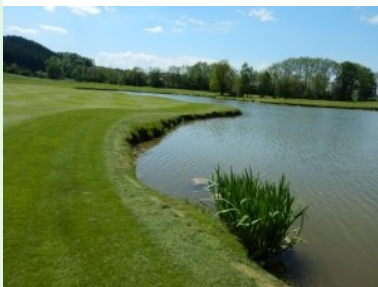
Landezone Loch 7