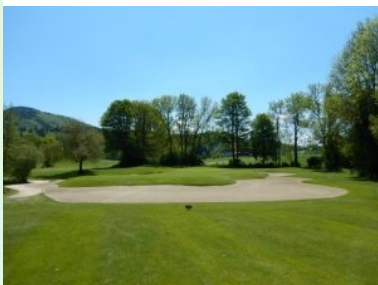
Grün Loch 4 (Par 3, 164m)