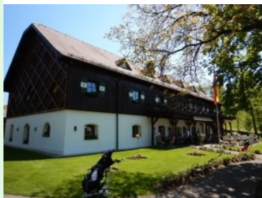
Das Clubhaus des GC Gut Altentann