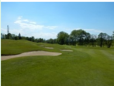
Annäherung Grün Loch 15 (Par 5, 438m)