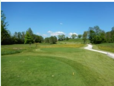
Loch 17 (Par 4, 329m)