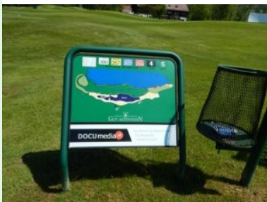
Infotafel am Platz des GC Gut Altentann