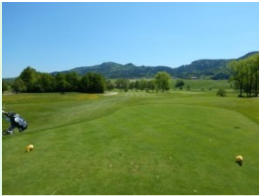
Loch 2 (Par 5, 422m)