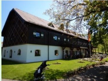
Das Clubhaus des GC Gut Altentann

Ein wunderschönen Platz in der sanft hügeligen Naturlandschaft des Salzburger Flachgaus