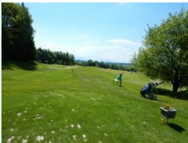
Loch 12 (Par 3, 137m)