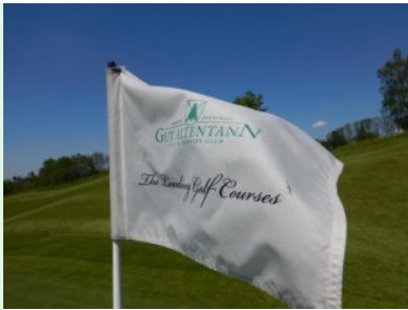
Flagge mit Logo des GC Gut Altentann