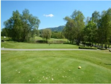
Loch 9 (Par 3, 149m) über den Teich

Zufahrtsstraße. Loch 9 (Par 3, 149m) führt über einen wunderschönen, von Baumgruppen eingerahmten Teich auf ein Doppelgrün (Grün 9 und Grün 18) das durch einen singulären Baum am hinteren Teichrand und einem Sandbunker getrennt ist. Bitte am Abschlag von Tee 9 um Vorsicht damit Sie bei ungenauen Teeshots keine Personen am 18er Grün gefährden!