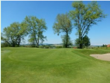
Grün Loch 14 (Par 4, 315m)

Loch 12 (Par 3, 137m) liegt an der höchsten Stelle des Platzes, das Fairway liegt unterhalb eines Waldes. Ein großer Sandbunker unterhalb des Grüns wartet auf ungenaue Teeshots. Loch 13 (Par 4, 323m) führt dann wieder bergab entlang der Straße hinauf zum Gut Aiderbichl weshalb links Out gepflockt ist. Loch 14 (Par 4, 315m) ist ein Dogleg nach links wobei auf der Innenseite drei lange Fairwaybunker auf ungenau geschlagene Bälle lauern. Loch 15 (Par 5, 438m) ist ein leicht bergab verlaufendes Doppeldogleg wobei der Teeshot durch die Öffnung einer Baumreihe hindurch erfolgt. Loch 16 (Par 3, 139m) ist ein wunderschönes Par 3 mit Wald und Wasser auf der linken Seite. Wenn Sie hier auf Nummer Sicher gehen