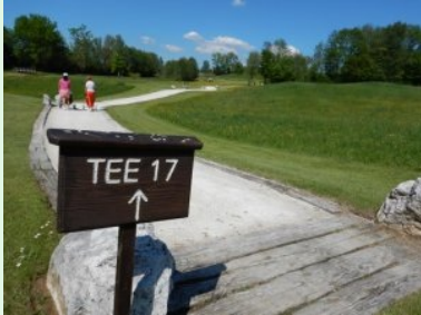
Am Weg zu Tee 17