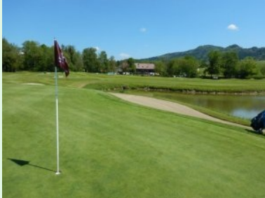
Grün Loch 6 mit Clubhaus im Hintergrund