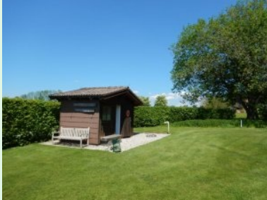
Häuschen bei Tee 11