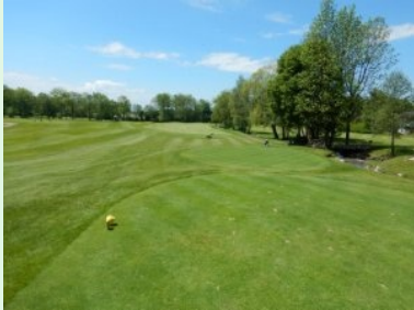
Loch 3 (Par 4, 390m)