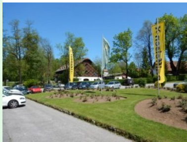
Blick vom Parkplatz Richtung Clubhaus