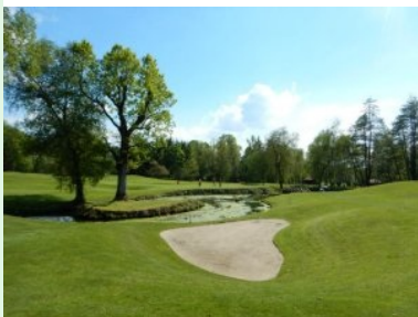
Annäherung Loch 18 mit Teich