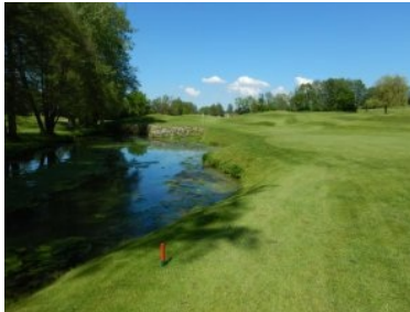
Loch 16 (Par 3, 139m)

wollen spielen Sie den Teeshot weiter rechts. Wenn Sie selbstbewusst spielen schlagen Sie den Ball über den Teich (mit Steinmauer hinauf zum Grün) direkt an die Fahne. Loch 17 (Par 4, 329m) ist ein Dogleg links das auf der Innenseite von Bäumen, einem Biotop und einem langen Fairwaybunker begrenzt wird. Das Grün von Loch 17 ist der nördlichste Punkt der Anlage. Loch 18 (Par 5, 431m) ist ein grandioses Finalloch in Altentann. Der Abschlag erfolgt von inselartigen Teeboxen im Biotop über eine Engstelle durch eine Baumreihe. Wenn Sie nicht extrem lang sind sollten Sie nichts riskieren und vorlegen. Der Annäherungsschlag über den Teich vorbei an alten Bäumen aufs Grün ist ein würdiger Abschluss einer wunderschönen Golfrunde auf der Anlage des Golfclubs Gut Altentann.