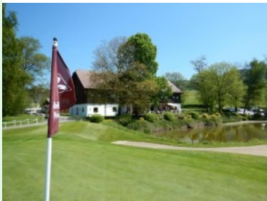
Grün Loch 8 mit Clubhaus