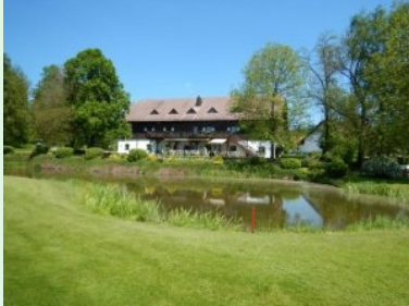
Blick vom Fairway Loch 8 Richtung Clubhaus