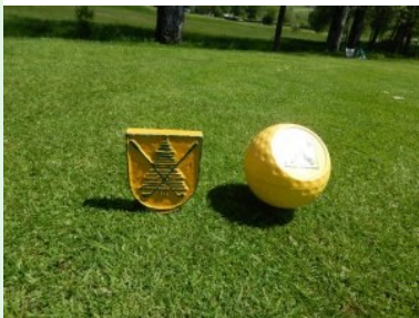
Teeboxmarker am GC Gut Altentann