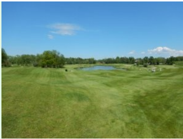
Loch 6 (Par 4, 359m)