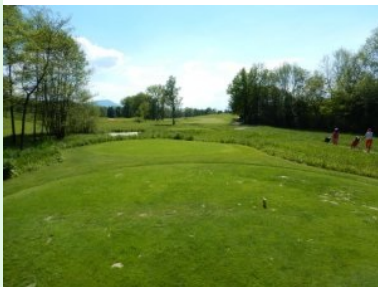
Loch 18 (Par 5, 431m)