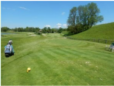
Loch 8 (Par 5, 434m)