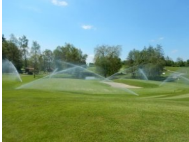
Bewässerung auf Loch 10

und Bäumen begleitet wird (Biotop), das Fairway. Auch auf Loch 7 ist das Design von Jack Nicklaus zu spüren: Eine kleine Verbreiterung der Landezone Richtung Teich bei rund 200m Entfernung von der Teebox erhöht die Chance minimal den Teeeshot nicht ins Wasser zu schlagen. Loch 8 (Par 5, 434m) ist ein Dogleg links um den vorher beschriebenen langgezogenen Sandbunker mit Biotop. Das ondulierte Grün von Loch 8 befindet sich direkt vor der Clubhaus, zwischen Grün und Clubhausterrasse liegt noch ein idyllischer kleiner Teich der allerdings nicht ins Spiel kommen sollte. Der Weg zu Loch 9 ist der gleiche wie der Weg vom Clubhaus zu Loch 1 - man quert wieder die