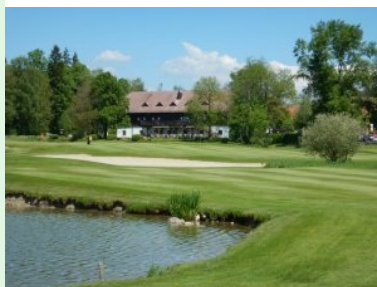
Blick vom Fairway 7 zurück zum Clubhaus

sehr genau sein, links begleitet ein Bach entlang einer Baumreihe das Fairway, weiter vorne quert ein Bach das Fairway. Dieser querende Bach liegt genau in der Landezone des Teeshots - hier habe ich das erste Mal gemerkt dass Jack Nicklaus beim Design des Golfplatzes wollte dass man als Golfer gefordert wird. Vorlegen oder attackieren...Danach beginnt eine über 100m langer Bunkerzone auf der linken Seite des Fairways