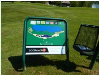
Infotafel am Platz des GC Gut Altentann