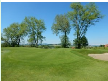
Grün Loch 14 (Par 4, 315m)