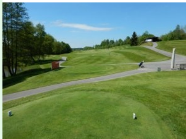
Loch 1 (Par 4, 329m)