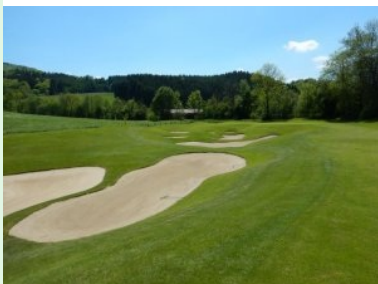
Bunkerkomplex auf Fairway Loch 5 (Par 4, 312m)