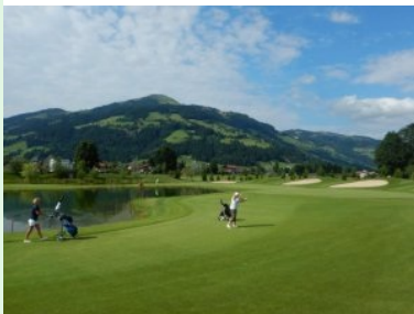
Grün Loch 9 (Par 4, 382m) mit den Teichen vor dem Clubhaus; im Hintergrund die Hohe Salve

geschnitten und die Bereiche zwischen den Spielbahnen aufgeforstet - man sieht dies sehr schön an der "Flying Scorecard" auf der Homepage, da werden die Spielbahnen aus der Vogelperspektive dargestellt. Mir gefallen die ersten Löcher des Platzes in Westendorf sehr gut. Der Pflegezustand der Fairways und Grüns ist hervorragend, durch die Lage der Spielbahnen im Wald ergeben sich sehr schöne Bilder. Auch die Grüns liegen wunderschön am Waldrand, teilweise von bewaldeten Hügeln bzw. kleineren Wäldchen begrenzt.