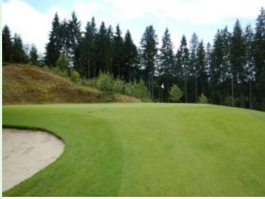
Grün Loch 1