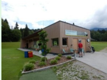
Drivingrange am Weg zu Tee 1