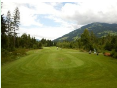
Loch 4 (Par 4, 293m)