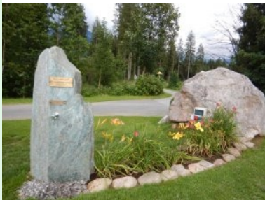
Brunnen und Blumeninsel bei Tee 14