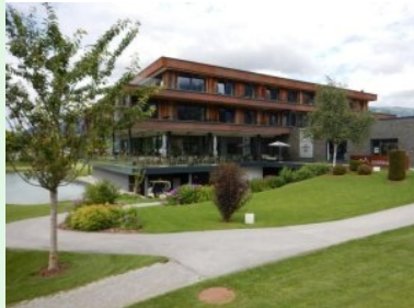
Das Clubhaus - Windau Lodge