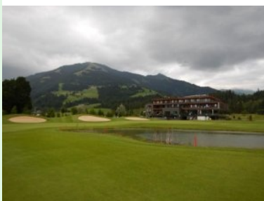
Grün Loch 18 - zurück im Clubhaus