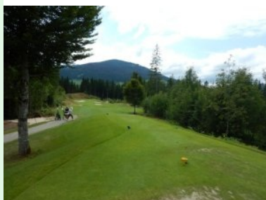
Loch 1 (Par 4, 221m)