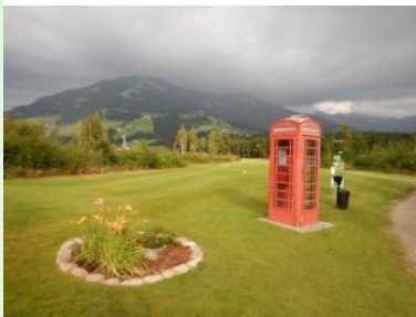
Rote Telefonzelle bei Tee 18