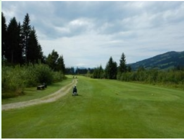
Loch 6 (Par 5, 471m)