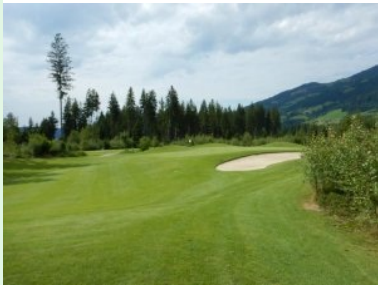
Grün Loch 6