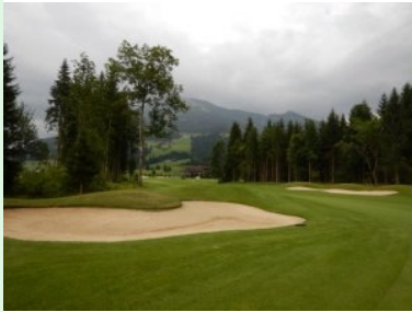
Loch 18 (Par 5, 468m)