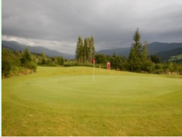
Grün Loch 17