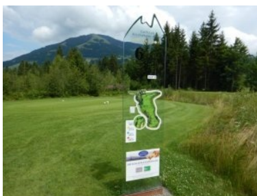
Etwas gewöhnungsbedürftig: Die durchsichtigen Infotafeln

der Windau Lodge vorbei führt und geht dann weiter vorbei an der Drivingrange zu Tee 1. Die Fairways von Loch 1 und Loch 2 sind aus dem Wald rausgeschnitten, die Spielbahnen liegen parallel in entgegengesetzter Richtung. Der Bereich zwischen den Spielbahnen wurde wieder mit Jungbäumen und Sträuchern bepflanzt. Loch 1 (Par 4, 221m von gelb) ist eine optisch wunderschöne Loch und ideal zum Aufwärmen weil kurz. Vor dem Grün lauern ein kleiner querender Bach und mehrere Sandbunker auf ungenau geschlagene Bälle. Loch 2 (Par 3, 126m) führt dann wieder zurück Richtung Drivingrange. Achtung: links vom Grün verteidigen drei kreisrunde Sandbunker das Grün. Weiter geht's dann über eine Straße zu den drei Löchern 3 (Par 5, 447m), Loch 4 (Par 4, 293m) und Loch 5 (Par 3, 155m) die ein Bündel an Spielbahnen bilden. Wieder sind die Fairways aus dem Wald