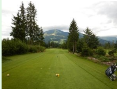
Loch 13 (Par 4, 308m)

Vom Grün 9 vor der Clubhausterrasse geht man dann ein paar Minuten zum Tee 10. Die Back-Nine bilden eine Schleife Richtung Norden wobei Grün 14 den Wendepunkt an der nördlichsten Stelle darstellt. Am Charakter des Platzes ändert sich wenig: Die Fairways sind aus dem Wald rausgeschnitten aber dennoch nicht allzu eng sodass auch