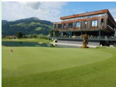
Windau Lodge mit Hoher Salve im Hintergrund