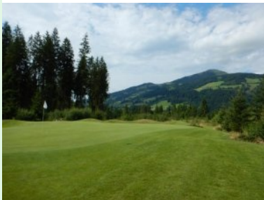
Grün Loch 7