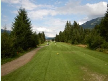
Loch 9 (Par 4, 382m)