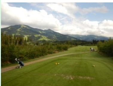
Loch 8 (Par 5, 492m)