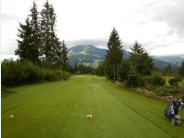
Loch 13 (Par 4, 308m)