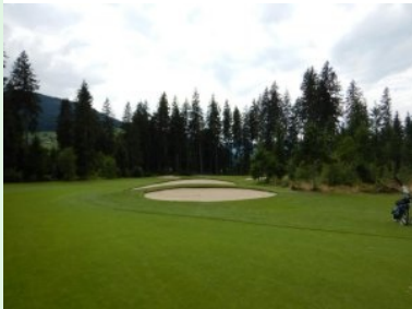
Grün Loch 3 (Par 5, 447m)