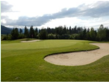
Grün Loch 11