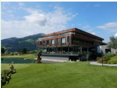
Die Windau Lodge beherbergt das Clubhaus des Golfclubs Kitzbüheler Alpen Westendorf

Juli 2017 - Der Platz des Golfclub Kitzbüheler Alpen Westendorf liegt im Ortsteil Holzham in der Gemeinde Westendorf im Brixental im Bezirk Kitzbühel. Westendorf liegt ca. 16km westlich von Kitzbühel auf halber Strecke zwischen Kitzbühel und Wörgl.