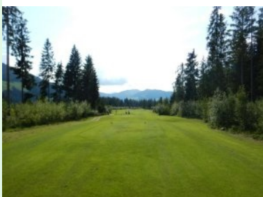
Loch 11 (Par 5, 478m)