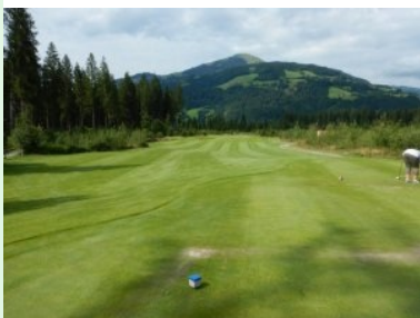
Loch 7 (Par 3, 136m)