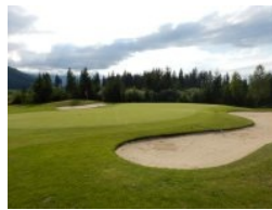
Grün Loch 11 (Par 5, 478m)

dann endgültig hinaus ins offene Gelände rund ums Clubhaus mit zwei großen Teichen links und rechts vor dem Grün. Ein weiterer (dritter) Teich vor der Clubhausterrasse kommt dann am Grün 18 ins Spiel.