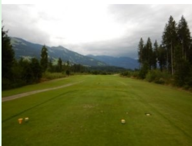
Loch 16 (Par 4, 307m)