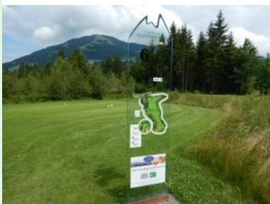
Durchsichtige Infotafel an Tee 6