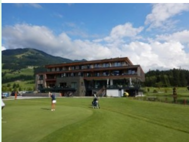
Grün Loch 9