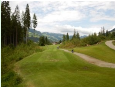
Loch 2 (Par 3, 161m)