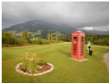
Tee 18 mit roter Telefonzelle

Der 18-Loch Platz des Golfclub Kitzbüheler Alpen Westendorf ist ein wunderschöner, gut gepflegter und herausfordernder Platz im Tiroler Brixental rund 16km westlich von Kitzbühel. Die flachen Spielbahnen des relativ neue Platzes (Eröffnung 2014) am Fuße der Hohen Salve sind durchwegs aus dem Wald geschnitten worden - was einerseits spielerisch eine Herausforderung darstellt und andererseits schön für das Auge ist. Für mich war die Runde in Westendorf ein wunderbares Golferlebnis - der Platz kann ohne weiteres mit dem ohnehin überdurchschnittlichen Niveau der