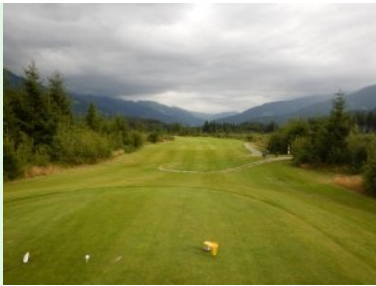
Loch 17 (Par 4, 307m)