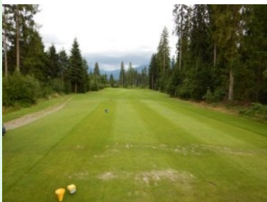
Loch 15 (Par 3, 135m)