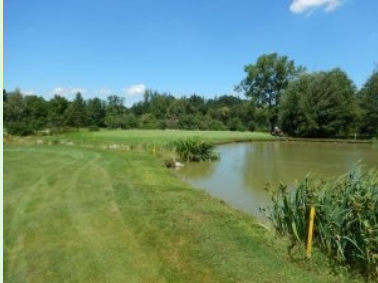
Grün Loch 5