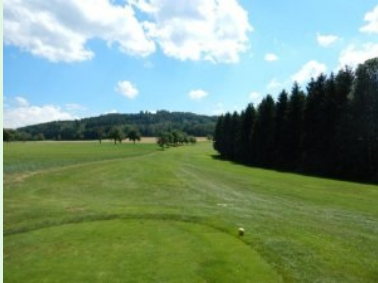
Abschlag Loch 14 (Par 5, 449m)