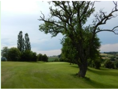
Annäherung Loch 17 (Par 4, 311m)