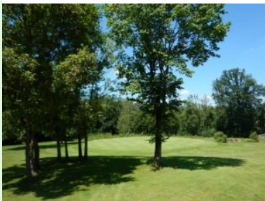
Grün Loch 3