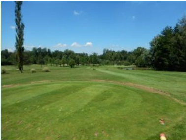
Loch 5 (Par 3, 129m)