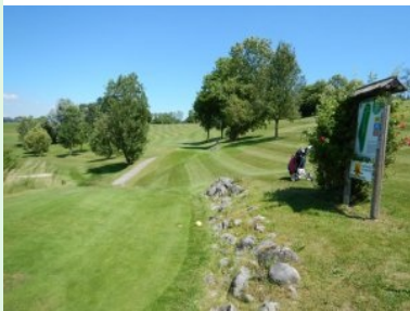
Loch 12 (Par 4, 349m)