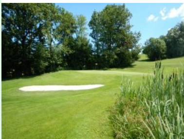
Grün Loch 4