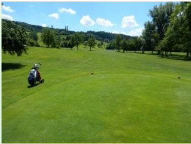
Loch 6 (Par 4, 267m)