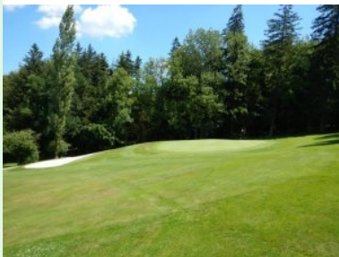
Grün Loch 1 (Par 4, 310m)