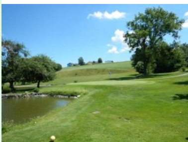
Blick von Tee 6 Richtung Grün 10