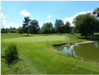
Grün Loch 10