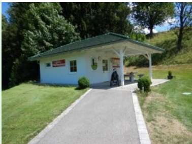
Halfwayhouse des GC Traunsee Kirchham