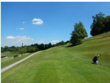
Loch 4 (Par 4, 283m)