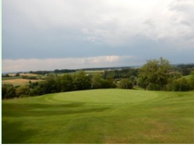
Grün Loch 17