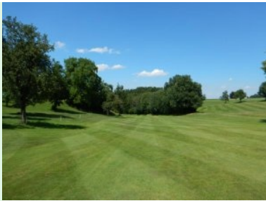
Fairway Loch 13; rechts Fairway 14