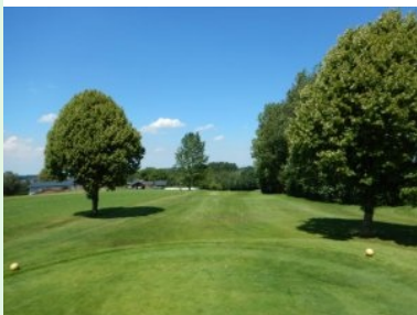
Loch 13 (Par 5, 460m)