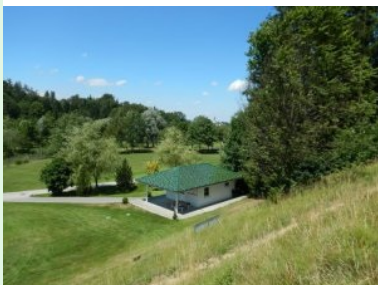
Am Weg zu Tee 10: Blick hinunter zum Halfwayhouse