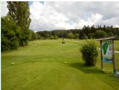
Loch 18 (Par 4, 245m)