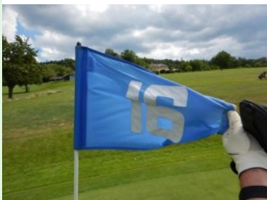
Blick hinauf zum Clubhaus