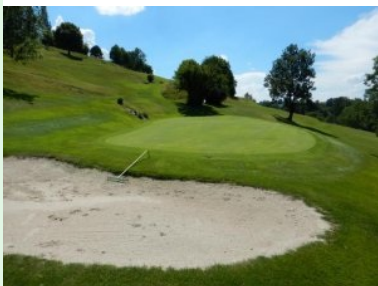
Grün Loch 11