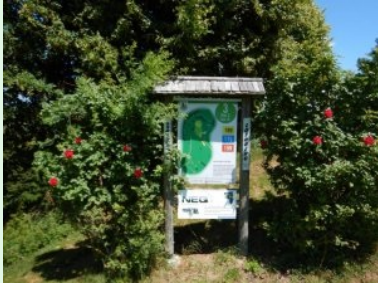
Infotafel am Platz des GC Traunsee Kirchham