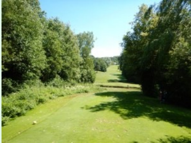
Loch 11 (Par 4, 286m)