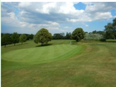
Grün Loch 16 (Par 3, 182m)