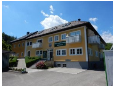
Das Clubhaus des GC Traunsee Kirchham

Juni 2018 - Der 18-Loch Platz des Golfclubs Traunsee Kirchham liegt in der Gemeinde Kirchham rund 10 km nordöstlich der Bezirkshauptstadt Gmunden bzw. sieben Kilometer südlich von Vorchdorf im Oberösterreichischen Traunviertel. Von der Westautobahn erfolgt die Zufahrt über die Abfahrt Vorchdorf. Im Zentrum von Kirchham bei der Kirche zweigt die Straße Richtung Südosten ab, rund zwei Kilometer sind es hinauf bis zum Clubhaus.