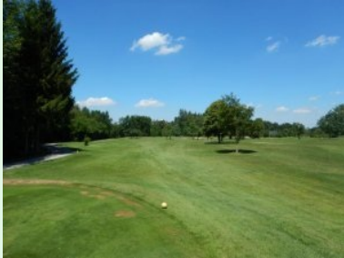
Loch 7 (Par 4, 341m)