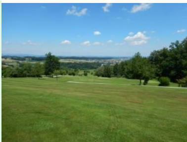
Blick Richtung Norden über Kirchham