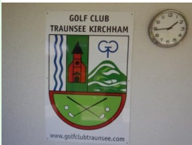
Logo des GC Traunsee Kirchham