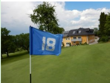
Grün 18 mit Clubhaus