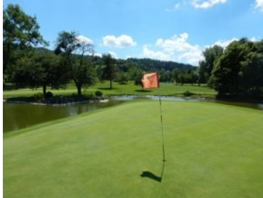
Grün Loch 7 (Par 4, 341m)

Wasserhindernis auf das Fairway das zum leicht erhöht liegenden Grün führt. Der Abschlag von Loch 12 (Par 4, 349m) führt durch Baumreihen hindurch leicht bergauf auf ein sehr breites Fairway das ein Hang mit Neigung/Schräglage ist. Das Grün liegt weit oben am Waldrand, hier geht's steiler bergauf. Die Löcher 13 und 14 (jeweils Par 5) liegen dann in einem Seitenarm der Anlage. Loch 13 führt in einer Linkskurve leicht bergab - links von einem Hügel und rechts von einer Baumreihe begrenzt. Loch 14 führt auf der anderen Seite der Baumreihe und leicht bergauf gehend parallel zum Fairway davor wieder zurück. Loch 15 (Par 4, 396m) legt dann parallel zu