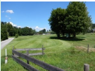
Abschlag Loch 8 (Par 4, 277m)