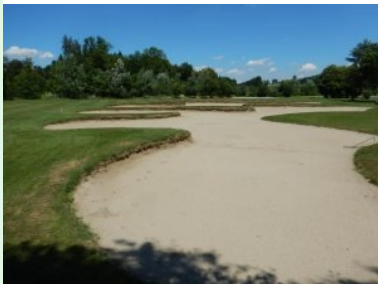
Riesiger Fairwaybunker auf Loch 7