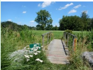
Brücke auf Grün 5