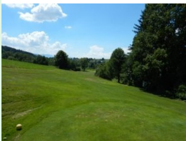
Loch 10 (Par 4, 285m)