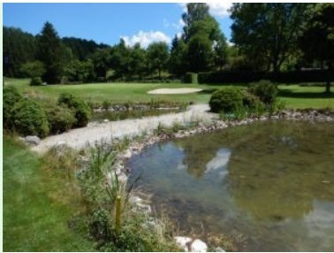
Annäherung Grün Loch 8