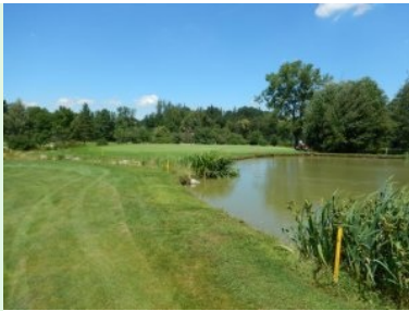
Grün Loch 5 (Par 3, 129m)

Loch 12 jedoch in umgekehrter Richtung. Das Grün ist schwer anzuspielen weil es auf einer Geländestufe relativ schmal aber langgezogen/tief liegt. Man befindet sich jetzt ungefähr auf halber Höhe zwischen dem untersten Niveau des Platzes und dem Clubhaus. Von hier hat man übrigens wieder einen schönen Blick über die Anlage - mit der Kirche von Kirchham im Hintergrund. Die Fairways von Loch 16 und Loch 17 bringen Sie dann in leichten Bergauf-Modus quer zum Hang liegend weiter bergauf Richtung Clubhaus. Beide Löcher haben wunderschön gelegene Grüns, Altbaumbestand lockert die Fairways optisch auf, erhöhen aber den Schwierigkeitsgrad. Loch 18 (Par 4, 245m) führt dann direkt hinauf zum Clubhaus.