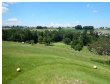
Loch 3 (Par 4, 199m)