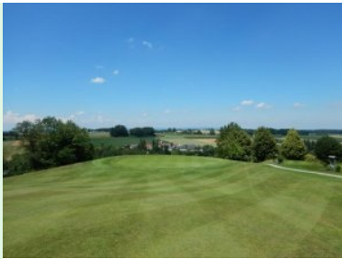
Grün Loch 2