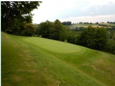
Grün Loch 15 (Par 4, 396m)