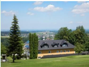
Blick hinunter zum Clubhaus