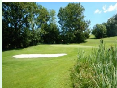
Grün Loch 4 (Par 4, 283m)