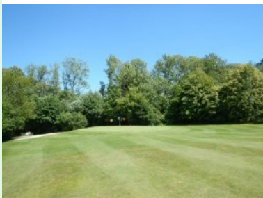
Grün Loch 12