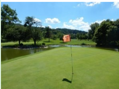
Grün Loch 7