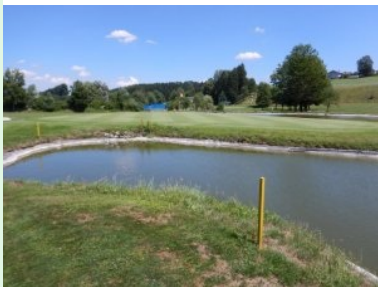
Annäherung Grün Loch 7