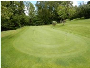
Puttinggreen oberhalb des Clubhauses am Weg zu Tee 1