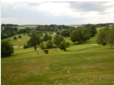
Blick über den Platz des GC Traunsee Kirchham