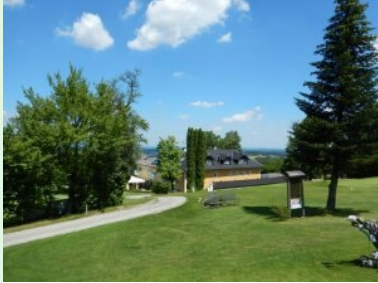
Blick von Tee 1 hinunter zum Clubhaus