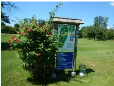
Infotafel bei Tee 6