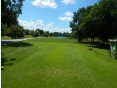
Loch 9 (Par 3, 181m)