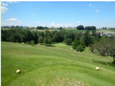
Loch 3 (Par 3, 199m)