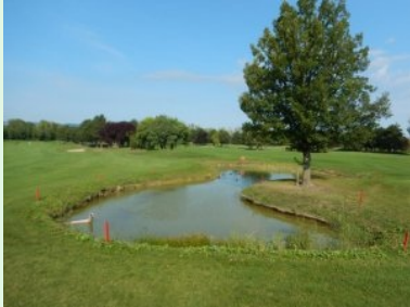
Teich neben Grün 13