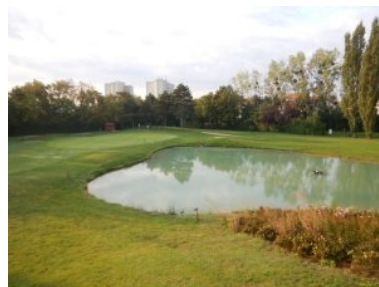
Grün Loch 4 (Par 4, 339m)

Den Auftakt der Runde bildet mit Loch 1 (Par 4, 356m von gelb) ein mittellanges Par 4 mit relativ breiter Landezone. Ein Teich rechts nach dem Abschlag sollte nicht ins Spiel kommen obwohl dieser aber offensichtlich magische Anziehungskraft hat. Vor dem Grün lauern drei über die Fairway-Breite schräg versetzte Bunker und eine Mulde auf ungenaue Annäherungsschläge. Loch 2 (Par 5, 426m) ist nicht nur formal das schwerste Loch am Platz (Index = 1) sondern auch wegen des Inselgrüns das Signature Hole des Platzes in Brunn am Gebirge. Der Teeshot erfolgt durch eine schmale Schneise hinaus auf eine etwas breitere Landezone. Mit dem zweiten Schlag gilt es den Ball möglichst nahe an die Teichkante zu spielen. Wenn