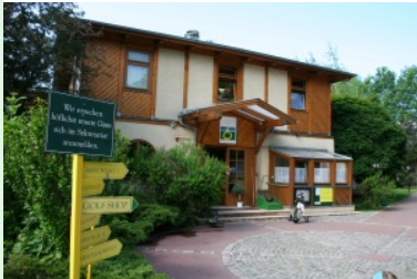
Das Clubhaus des G&CC Brunn am Gebirge