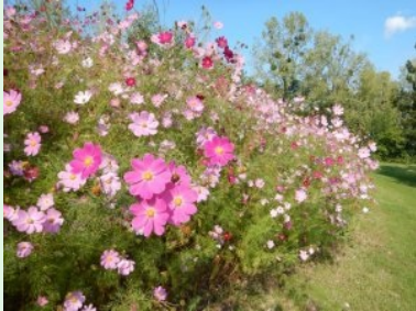
Blumenwiese/Hügel neben Fairway 16