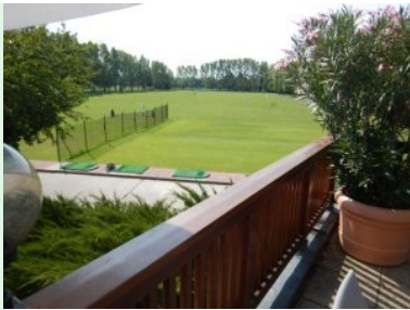
Blick von der Clubhausterrasse hinunter zur Drivingrange