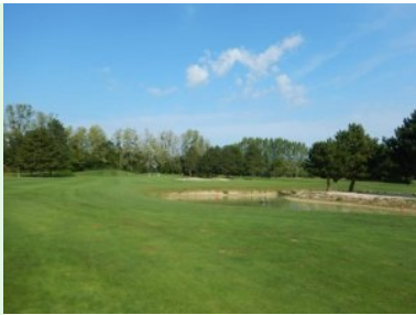
Loch 16 (Par 4, 330m)