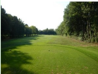
Loch 15 (Par 3, 214m)