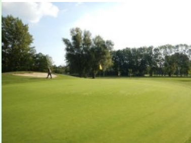
Grün Loch 11 mit Herz-Bunker