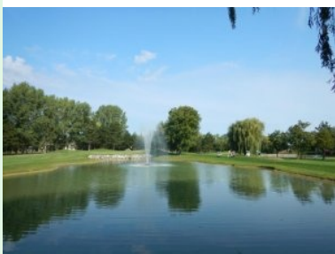
Teich mit Springbrunnen zwischen Fairway 1 und 18