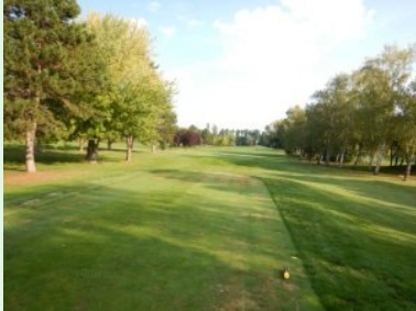
Loch 11 (Par 4, 336m)