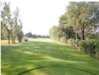
Loch 12 (Par 4, 426m)