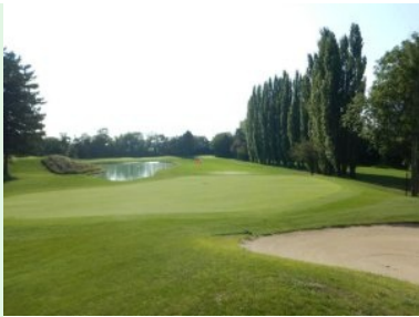
Blick zurück über Grün 5