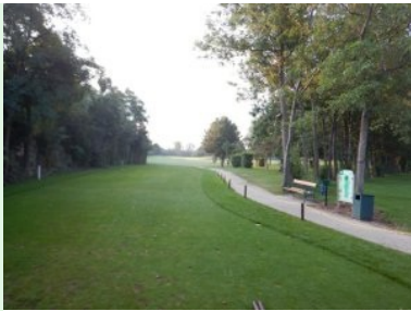
Loch 3 (Par 3, 147m)