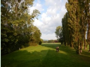
Abschlag Loch 6 (Par 4, 351m)