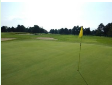
Blick zurück von Grün 16