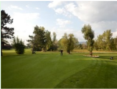
Grün Loch 9