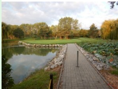
Weg zum Inselgrün