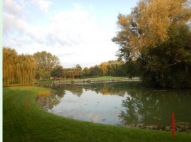
Loch 2 mit Halbinselgrün