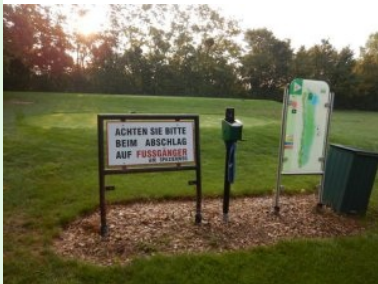
Infotafel bei Tee 4