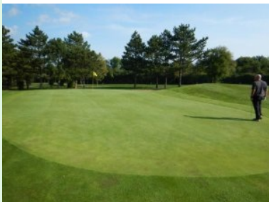
Grün Loch 14 (Par 4, 264m)