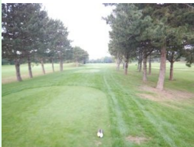
Abschlag Loch 7 (Par 4, 325m)