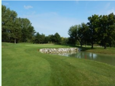
Grün Loch 18 (Par 4, 312m)

undulierte Grün wird rechts von einem Teich und links von einem Sandbunker verteidigt. Loch 14 (Par 4, 264m) ist ein kurzes aber schwer zu spielendes Dogleg nach links. Ein langer Fairwaybunker (links) und ein riesiger Grünbunker (rechts) bestrafen ungenaue Annäherungsschläge. Das stark undulierte Grün macht das Putten zur Herausforderung. Loch 15 (Par 3, 214m) ist das längste Par 3 am Platz. Loch 16 (Par 4, 330m) ist ein Dogleg nach rechts. Im Knie des Dogleg liegt ein Teich den man idealerweise mit dem zweiten Schlag überspielt. Das Grün von Loch 17 (Par 3, 149m) wird von einer riesigen Waste Area (rechts vorne, seitlich und hinten) mit singulären Bäumen drinnen und einem Teich außerhalb der Waste Area verteidigt. Loch 18 (Par 4, 312m) ist ein kurzes Par 4 das man aber nicht unterschätzen sollte, weil es Richtung Grün hin immer enger wird, rechts lauert auch noch ein Wasserhindernis.