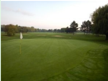
Blick zurück von Grün 1