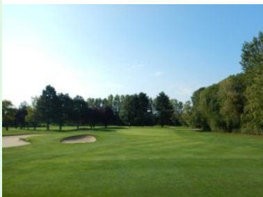
Grün Loch 12