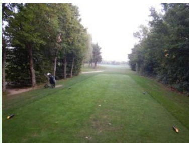
Loch 2 (Par 5, 426m)