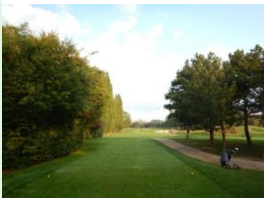
Loch 5 (Par 3, 136m)