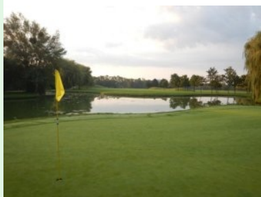
Blick zurück von Grün 2