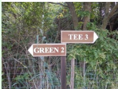
Wegweiser am Platz des G&CC Brunn am Gebirge