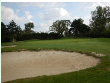
Grün Loch 8 (Par 5, 469m)