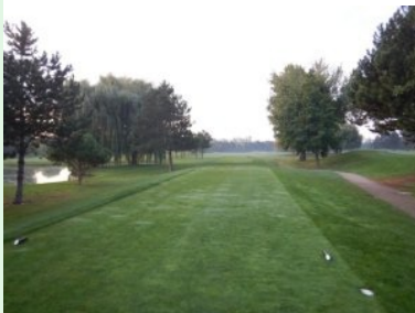
Tee 1 (Par 4, 356m)