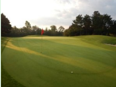
Grün Loch 3