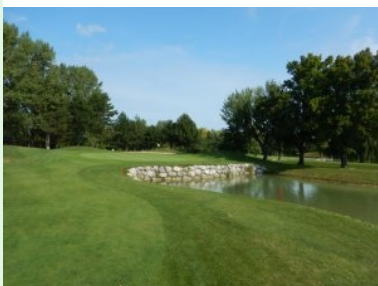
Grün Loch 18 (Par 4, 312m)