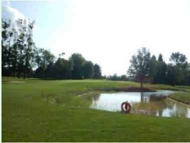
Annäherung Grün Loch 13 (Par 4, 373m)