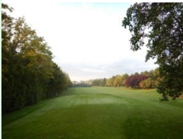
Abschlag Loch 4 (Par 4, 339m)