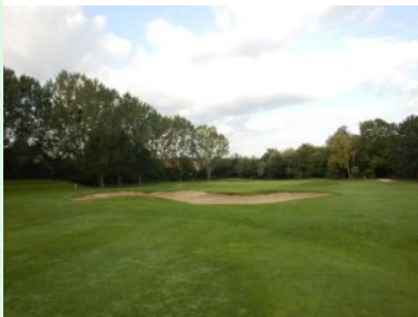
Grün Loch 7