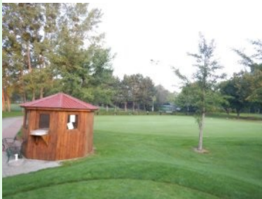
Blick von Tee1 zurück zum Starthaus und Putting Green