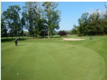
Grün 15, Blick Richtung Tee 16