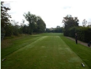
Loch 9 (Par 3, 150m)