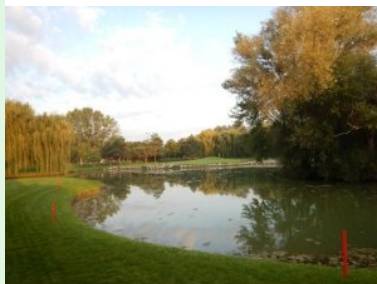
Loch 2 (Par 5, 426m) mit Inselgrün

Die Front-Nine in Brunn am Gebirge führen U-förmig auf drei Seiten des rechtwinklig angelegten 40ha Arealen außen herum. Die Back-Nine liegen auf der Innenseite der Anlage.