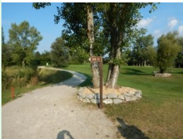
Am Weg zu Tee 12