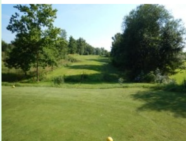
Abschlag Loch 5 (Par 4, 304m)