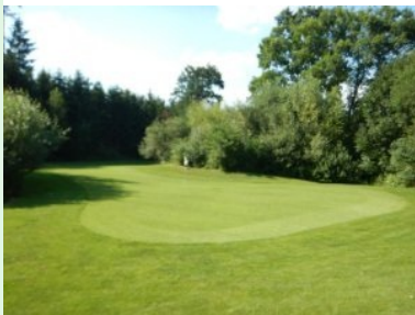
Grün Loch 4