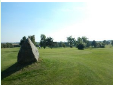
Grün Loch 8