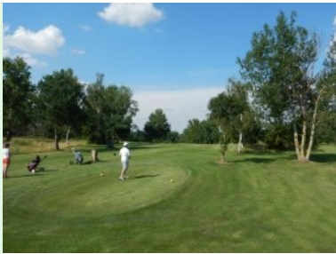
Abschlag Loch 4 (Par 4, 272m)