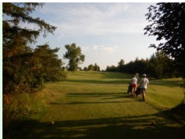
Abschlag Loch 14 (Par 4, 296m)