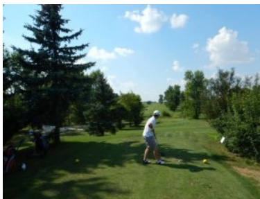
Abschlag Loch 1 (Par 4, 244m)

Loch 1 (Par 4, 244m von gelb) ist ein schönes Eröffnungsloch. Auf Grund der Länge ist es nicht allzu schwer. Mit dem Teeshot ist ein Biotop in einer leichten Senke zu überwinden, das aber nicht wirklich ins Spiel kommen sollte. Bäume und Büsche links und rechts der Abschlagzone bilden eine Art Schneise. Entlang des Fairways und in der Landezone ist das Fairway von singulären Bäumen zum Nachbarfairway hin begrenzt. Loch 2 (Par 3, 121) geht leicht bergauf, links ist Out-of-