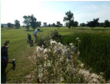
Wasserniendernis auf Loch 11