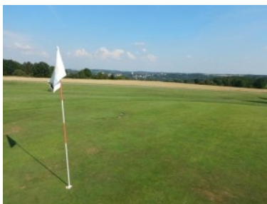
Grün Loch 8 (Par 4, 303m) mit Drosendorf im Hintergrund

Hole. Loch 5 (Par 4, 304m) führt von einem erhöhten Abschlag im bewaldeten Teil des Golfplatzes leicht bergauf durch eine engere Schneise mit Wasserhindernissen (seitlich und frontal). Das Grün von Loch 5 liegt dann wieder im offenen Gelände. Der Teeshot von Loch 6 (Par 4, 266m) führt entlang von Baumreihen die das Fairway stark einengen. Zum Grün geht es leicht bergab, das Gelände öffnet sich wieder. Das wunderschöne Loch 7 (Par 3, 140m) bildet den nördlichen Rand der Golfanlage und führt von erhöhten Teeboxen durch eine Schneise über ein frontales Wasserhindernis hinauf zu einem ondulierten Grün am Waldrand. Für mich ist Loch 7 neben Loch 4 das zweite Signaturehole in Drosendorf. Die Löcher 8 und 9 (jeweils Par 4) bringen Sie dann entlang der Ostgrenze des Platzes zurück zum Clubhaus, die Asphaltstraße links der beiden Fairways ist jeweils Out-of-Bounds. Von hier hat man einen herrlichen Blick auf die Stadt Drosendorf mit dem Schloss und der Kirche auf dem Hügel. Loch 9 (Par 4, 364m) ist das längste Loch am Platz, es wird rechts von der Drivingrange begrenzt.