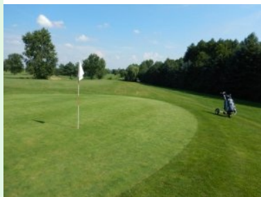
Blick zurück von Grün Loch 1