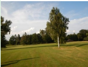
Fairway Loch 13 (Par 4, 301m)