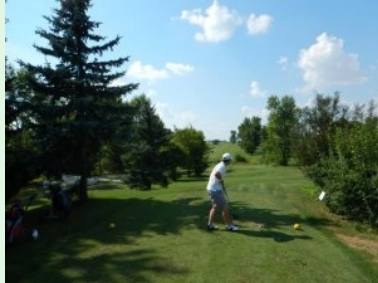
Abschlag Loch 1 (Par 4, 244m)