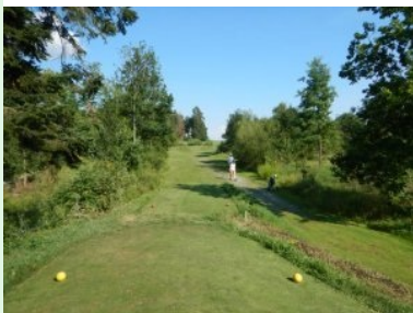
Loch 7 (Par 3, 140m)