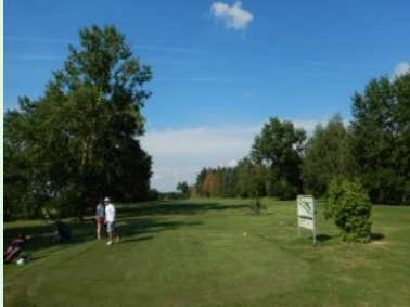
Abschlag Loch 6 (Par 4, 266m)