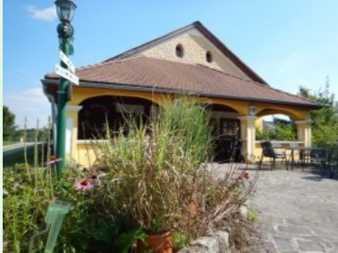
Das Clubhaus des GC Thayatal Drosendorf