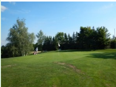
Grün Loch 9