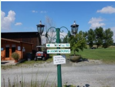
Laterne mit Wegweiser