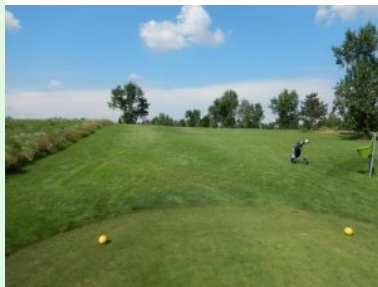
Loch 2 (Par 3, 121m)