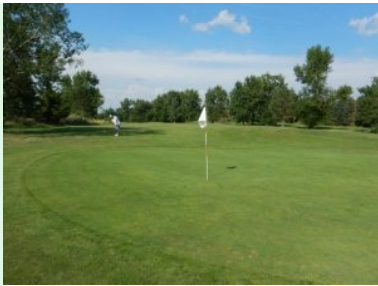
Blick zurück von Grün Loch 5