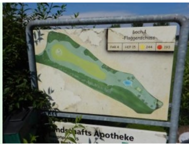
Infotafel am Platz des GC Thayatal Drosendorf