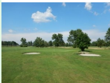
Grün Loch 2