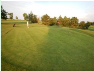
Grün Loch 18