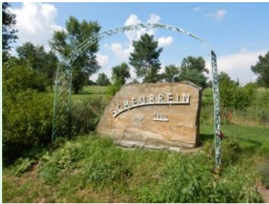
Der Platz gehört der Familie Scheubrein