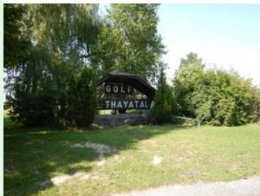
Herzlich willkommen im GC Thaytal Drosendorf