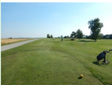
Abschlag Loch 8 (Par 4, 303m)