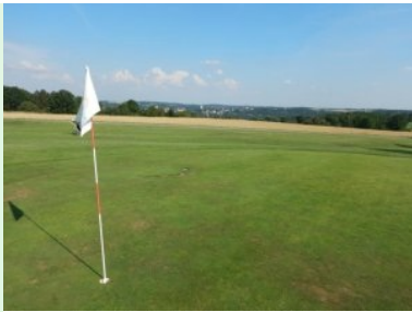
Grün Loch 8 (Par 4, 303m) mit Drosendorf im Hintergrund