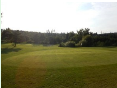
Grün Loch 13