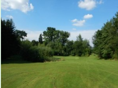
Ännäherung Grün Loch 4