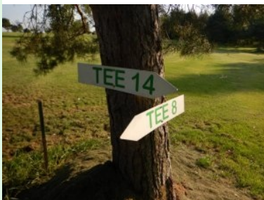
Wegweiser am Platz des GC Thayatal Drosendorf