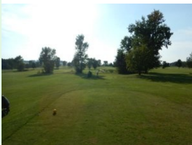
Abschlag Loch 11 (Par 4 300m)