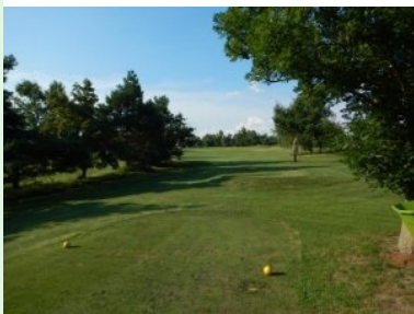
Loch 10 (Par 3, 146m)