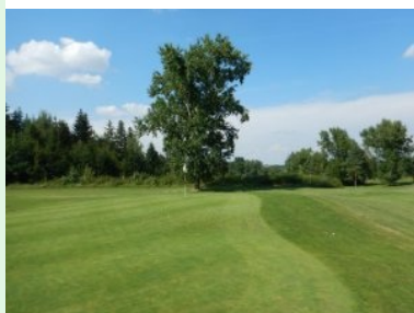
Grün Loch 3 (Par 4, 331m)