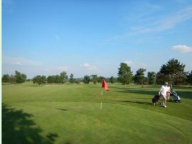
Blick zurück von Grün 11