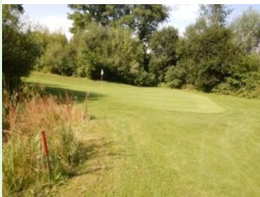
Grün Loch 4