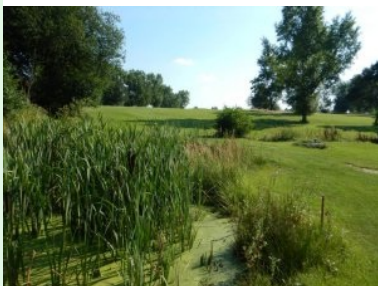
Wasserhindernis auf Loch 5