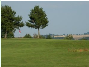
Grün Loch 12 (Par 4, 295m)