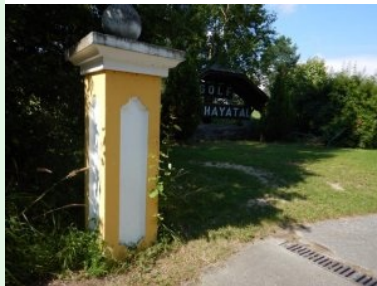
Zufahrt zum GC Thayatal Drosendorf