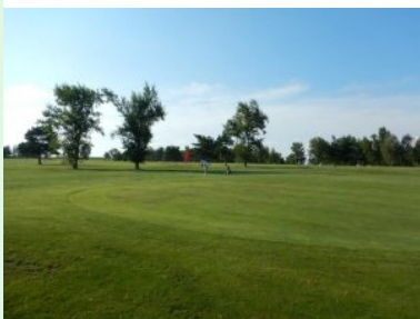
Grün Loch 10