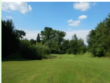
Annäherung Grün Loch 4 (Par 4, 272m)

Bounds gepflockt. Das Grün bildet ein Doppelgrün mit Loch 17. Zwei Sandbunker verteidigen das Grün. Leider sind die Bunkeranten in keinem guten Zustand - diese könnten mehr Pflege vertragen. Loch 3 (Par 4, 300m) ist ein Dogleg rechts entlang des Westgrenze des Platzes (wieder ist links Out gepflockt), das Loch ist formal das schwerste Loch am Platz (Index = 1). Loch 4 (Par 4, 272m) ist ein wunderschönes Loch, die zweite Hälfte liegt im Wald. Ein Wasserhindernis seitlich in der Landezone und vor dem Grün bzw. Wald und Wasser hinter dem Grün machen ein gutes Scoring zur Herausforderung. Das Grün liegt wunderschön am Waldrand - eine Augenweide. Für mich das schönste Loch in Drosendorf und auch das Signature