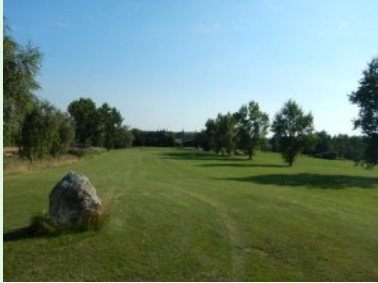
Loch 9 (Par 4, 364m)