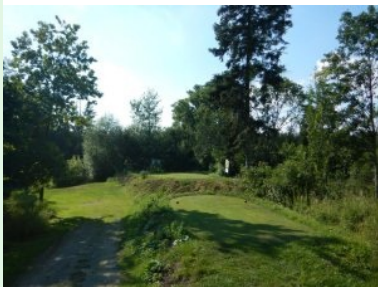
Blick zurück auf die Teeboxen von Loch 7