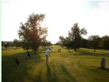
Abschlag Loch 15 (Par 4, 289m)