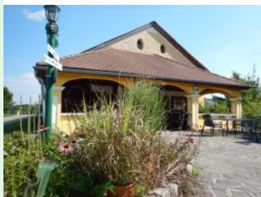
Das Clubhaus des GC Thayatal Drosendorf

August 2020 - Drosendorf an der Thaya liegt im niederösterreichischen Waldviertel (Bezirk Horn) an der Grenze zu Tschechien, rund 100km und 1,5 Autostunden (über Hollabrunn) nordwestlich von Wien. Bei Drosendorf überquert die Thaya die Staatsgrenze Richtung Tschechien um dann rund 60km östlich bei Laa an der Thaya wieder kurz nach Österreich zurück zu kommen. Drosendorf mit seinem historischen Kern liegt auf einem Hügel - der Golfplatz liegt rund zwei Kilometer westlich davon im Ortsteil Autendorf . Von Drosendorf kommend ist der Golfplatz beschildert. Der Parkplatz und das Clubhaus liegen - von Drosendorf kommend - rechts oberhalb der Straße. Das Clubhaus ist ein Landgasthaus.