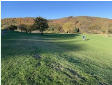
Fairway Loch 2 (beim ersten Dogleg)