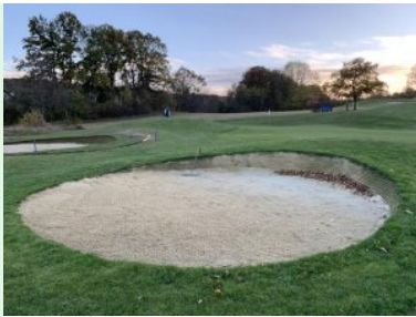
Grün Loch 8 (Par 4, 241m)

Dogleg nach rechts wieder bergab, das Grün von Loch 9 liegt am Teich den man bei Loch 7 überspielt. Ein sehr anspruchsvolles Schlussloch, dass sowohl Länge als auch Präzision erfordert.