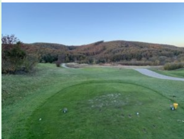
Loch 9 (Par 4, 357m)