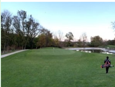
Grün Loch 9