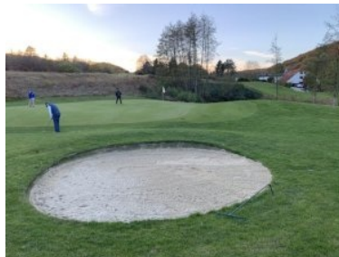
Grün Loch 7 (Par 3, 116m)

Unterhalb des Grüns ist links ein schöner, großer Sandbunker positioniert. Loch 4 (Par 4, 340m) ist ein Dogleg rechts entlang eines Waldes am oberen Rand des Golfplatzes. Der Teeshot erfolgt blind weil die Landezone hinter einer Kuppe nicht einsehbar ist, allerdings dient eine lange Stange als Orientierungshilfe. Am Ende des Knies wartet ein langgezogener Fairwaybunker auf zu lange Abschläge. Die Schwierigkeit dieses Lochs ist auch das Out-of-Bounds rechts, das entlang des gesamten Fairways die Grenze zum Wald markiert. Das Grün wird links von einem Bunker verteidigt und liegt an der höchsten Stelle des Platzes. Loch 5 (Par 3, 151m) liegt in einer Waldlichtung und führt bergab. Es gibt wenig Spielraum für ungenaue Bälle weil links und rechts vom Grün der Wald beginnt, rechts unterhalb des Grüns verteidigt zusätzlich ein Sandbunker das Grün.