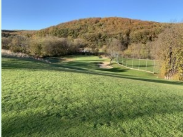
Blick hinunter zu Grün Loch 2