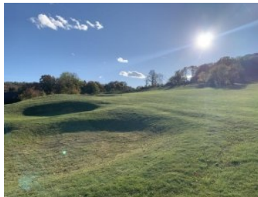
Annäherung Grün Loch 1

Der Platz ist hügelig und liegt an einem Hang des Wienerwaldes der nach Nordosten ausgerichtet ist - man schaut also Richtung Breitenfurt und Kalksburg/Wien zurück. Die Lage des Golfplatzes kann als Grünruhelage beschrieben werden - ringsum Wald und Grün so weit das Auge reicht. Für die Mountainbiker unter den Golfern: Die bekannte Parapluie-Strecke (von Rodaun, Wien nach Sulz im Wienerwald) führt direkt oberhalb des Golfplatzes im Wald vorbei.