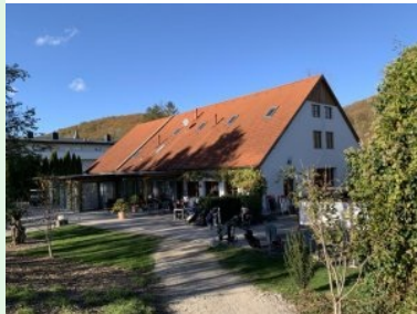
Das Clubhaus des GC Breitenfurt

November 2023 - Rund zehn Kilometer südwestlich von Wien liegt die Marktgemeinde Breitenfurt idyllisch im niederösterreichischen Bezirk Mödling im Wienerwald. Der Golfplatz liegt - von Wien/Kalksburg kommend - am Ende von Breitenfurt Ost südlich der Hauptstraße, die Zufahrt zum Golfplatz ist beschildert.