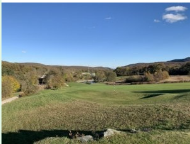
Blick von Tee1 hinüber zu Loch 9