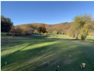
Grün Loch 2 (Par 5, 551m)