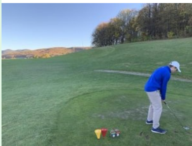
Loch 4 (Par 4, 340m)