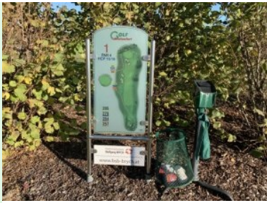
Infotafel bei Tee 1