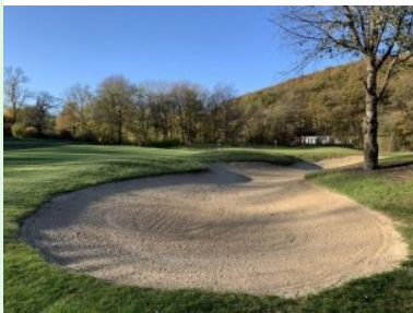
Grün Loch 2