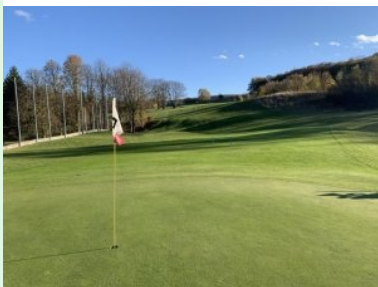
Blick zurück von Grün Loch 2