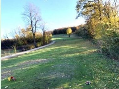
Loch 3 (Par 4, 249m)