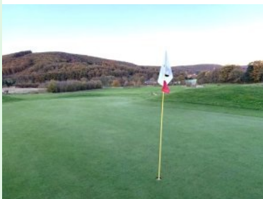
Blick zurück von Grün Loch 8