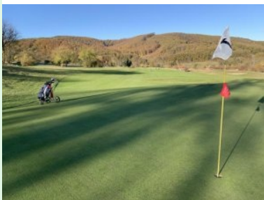
Blick zurück von Grün Loch 1