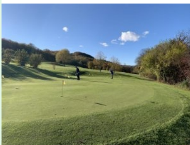
Puttinggreen neben Tee 1