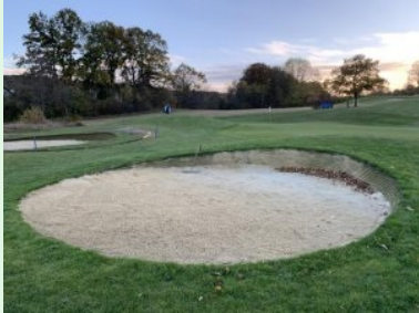
Grün Loch 8