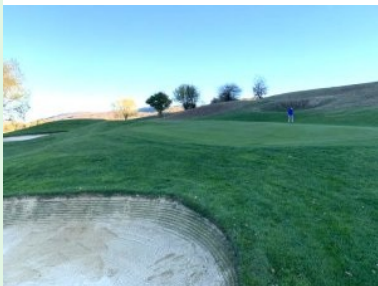
Grün Loch 3