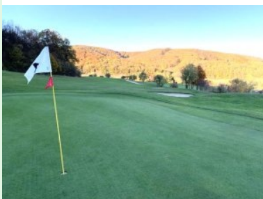
Blick zurück von Grün Loch 4