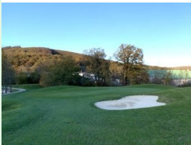
Grün Loch 6