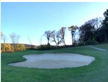
Grün Loch 4