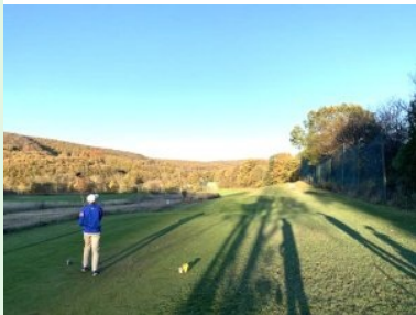
Loch 6 (Par 4, 304m)