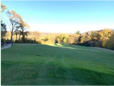
Loch 5 (Par 3, 151m)