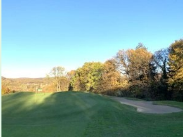
Grün Loch 5