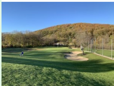
Grün Loch 2 (Par 5, 551m)

Der Weg zum ersten Tee führt vom Clubhaus auf eine Anhöhe oberhalb des Clubhauses, dort befindet sich auch das Putting Green. Loch 1 (Par 4, 285m von gelb) ist ein typisches Eröffnungsloch - nicht zu schwer und gut geeignet um ins Spiel zu kommen. Das Fairway ist breit, man kann hier den Driver nehmen - rechts und links ist relativ viel Platz für ungenau geschlagene Bälle, aber links lauern