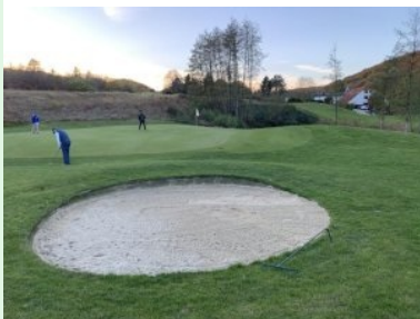
Grün Loch 7 (Par 3, 116m)