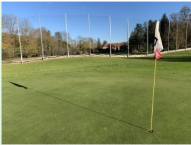
Blick von Grün 2 Richtung Drivingrange, dahinter das Kloster St. Josef