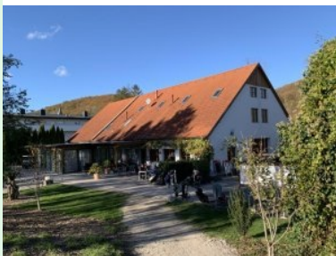
Das Clubhaus des GC Breitenfurt