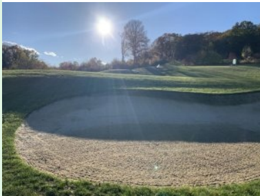
Grün Loch 1