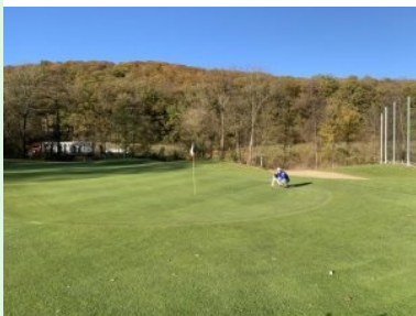
Grün Loch 2