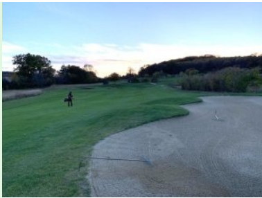
Fairway Loch 8