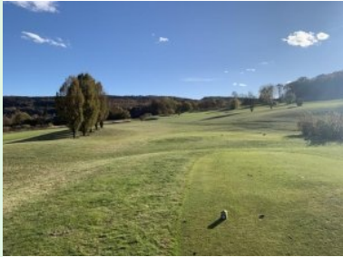
Loch 1 (Par 4, 285m)