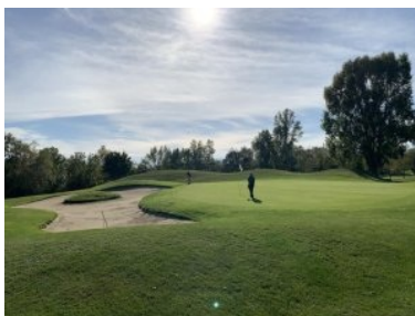
Grün Loch 3 (Par 5, 437m)

Nachbarfairway landen und damit zumindest weiter spielbar sind. Grün 2 wird vorne von einem großen und hinten gleich von mehreren kleinen Sandbunkern verteidigt. Loch 3 (Par 5, 437m) ist das längste Loch am Platz und eines von zwei Par 5. Das Fairway führt entlang des Ostgrenze des Platzes in einer Art Wanne bergab weil links und rechts Erdwälle die Spielbahn begrenzen. Vor dem Grün öffnet sich die Bahn, es geht über einen Teich runter auf das Grün. Ein riesiger Bunker links (mit Bunkerinsel) erschwert den Annäherungsschlag. Die ersten drei Löcher bilden die äußere Schleife des Platzes, die folgenden Löcher 4 bis 7 bilden die innere Schleife. Die beiden Abschlusslöcher verlaufen dann entlang des südlichen Endes des Golfplatzes. Loch 4 (Par 4, 375m) führt parallel zu Loch 3 (aber in umgekehrter Richtung) wieder bergauf. Loch 5 (Par 4, 279m) verläuft flach und parallel zu Loch 2 aber in umgekehrter Richtung. Loch 6 (Par 3, 151m) ist das erste Par 3 am Platz. Die Spielbahn ist links und rechts von Bäumen begrenzt, insgesamt vier Sandbunker lauern auf ungenaue geschlagene Teeshots. Loch 7 (Par 5, 441m) führt dann wieder leicht bergab. Das Fairway bildet ein leichtes Dogleg nach links und ist wieder links und rechts von