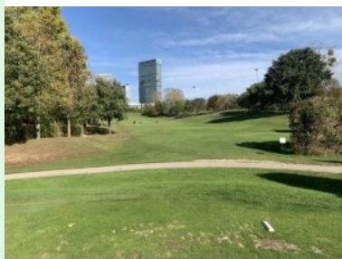
Loch 1 (Par 4, 293m)