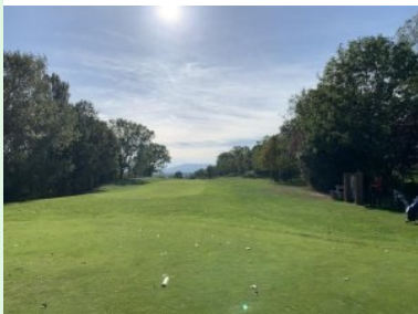
Loch 3 (Par 5, 437m)