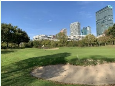
Grün Loch 6