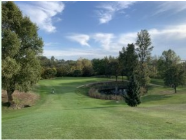
Am Weg hinunter zu Grün 8