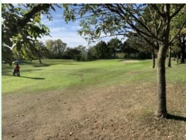
Fairway Loch 5