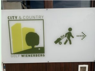
Der Weg zum Golfplatz