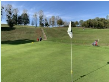
Blich hinauf zu Tee 4