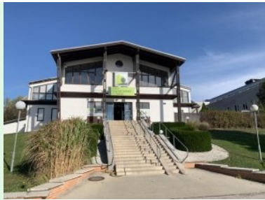
Das Clubhaus des GC Wienerberg