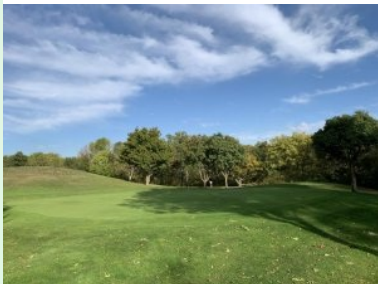
Grün Loch 8