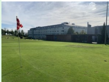
Blick hinüber zur Drivingrange mit dem Hotel Bosei