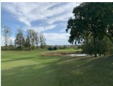
Annäherung Grün Loch 7