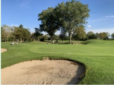
Grün Loch 6