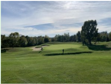
Annäherung Grün Loch 3