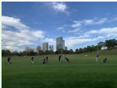
Vorbei an der Drivingrange - zurück zum Clubhaus