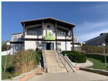
Das Clubhaus des C&C Golfclub Wienerberg

Oktober 2023 - Der 9-Loch Golfplatz (Par 36) des City & Country Golfclub Wienerberg liegt im zehnten Wiener Gemeindebezirk (Favoriten) unterhalb der Büro-Hochhäuser am Wienerberg. Das Clubhaus liegt unweit vom Budo-Center (eine Sporthalle/Eventlocation mit achteckige Grundform und einem markanten japanisches Dach) bzw. direkt benachbart zum Hotel Bosei in der Gutheil-Schoder-Gasse 7, die Zufahrt Erfolgt über die Triesterstraße.