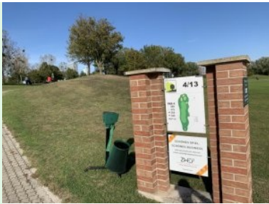
Infotafel bei Tee 4