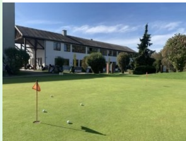
Putting Green mit Clubhaus