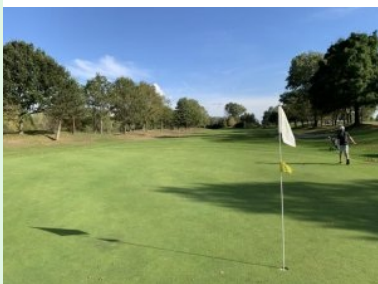
Blick zurück von Grün Loch 5