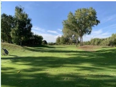
Loch 5 (Par 4, 279m)