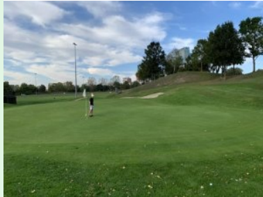
Grün Loch 9