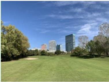
Fairway Loch 1