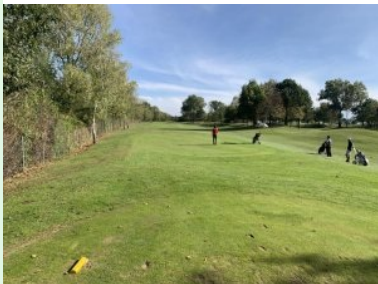
Loch 2 (Par 4, 305m)