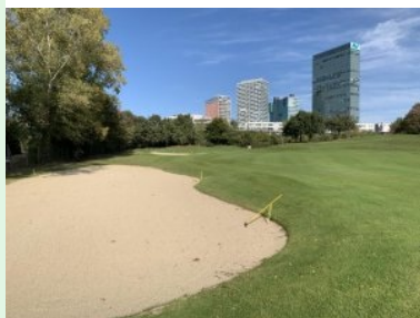
Fairway Loch 1 (Par 4, 293m)

Loch 1 (Par 4, 293m von gelb) beginnt direkt hinter der Terrasse des Clubhauses, das Fairway geht leicht bergauf entlang der Westseite des Golfplatzes. Links wird das Fairway von einer dichten Baumreihe begrenzt. Das erhöhte Grün wird von zwei Sandbunker verteidigt. Loch 2 (Par 4, 305m) liegt flach am oberen, nördlichen Ende des Golfplatzes. Links begrenzt ein Zaun und eine dichte Baumreihe die Spielbahn. Wie fast alle Fairways am Wienerberg ist auch dieses Fairway nicht allzu breit - allerdings besteht die Hoffnung dass ungenau geschlagene Bälle am