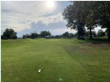
Loch 7 (Par 5, 441m)