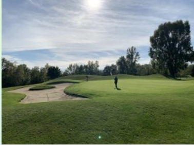
Grün Loch 3