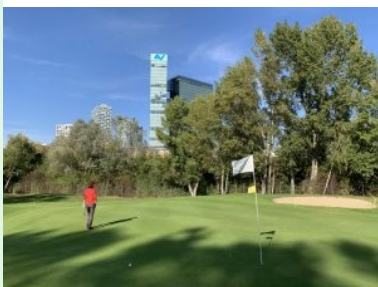
Blick zurück von Grün Loch 2