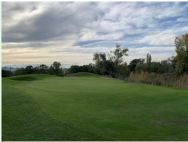
Grün Loch 7