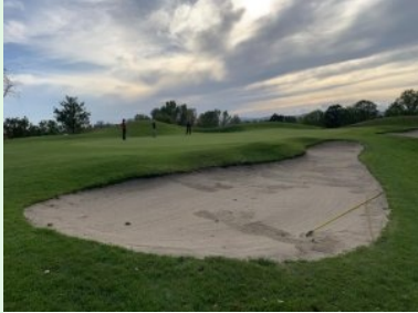
Grün Loch 7