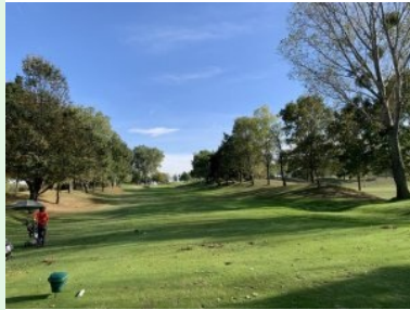
Loch 6 (Par 3, 151m)

Erdwällen begrenzt. Wenn Sie den Teeshot slicen oder aus anderen Gründen nach rechts verziehen dann landet der Ball unweigerlich auf der Drivingrange. Wieder öffnet sich die Spielbahn am Ende des Fairways. Ein großer Teich macht sich vor den Grün breit. Zusätzlich machen mehrere Grünbunker den Annäherungsschlag zur Herausforderung. Das Loch ist - zumindest was den Annäherungsschlag betrifft - eine echte Herausforderung. Das nachfolgende Loch