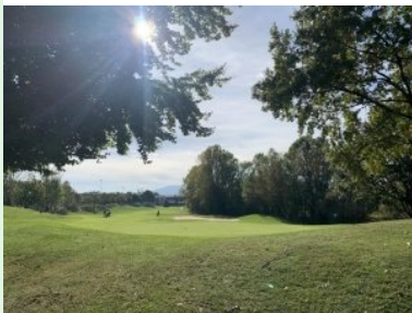
Blick von Tee 2 zurück zu Loch 1