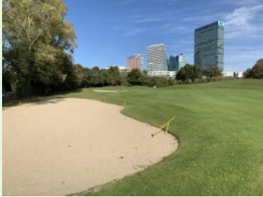
Annäherung Grün Loch 1