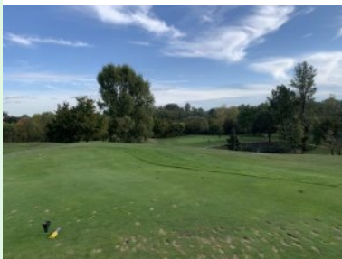
Loch 8 (Par 3, 110m)