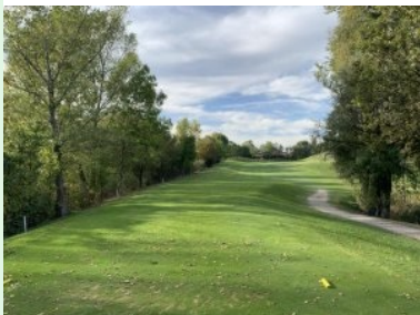
Loch 9 (Par 4, 338m)