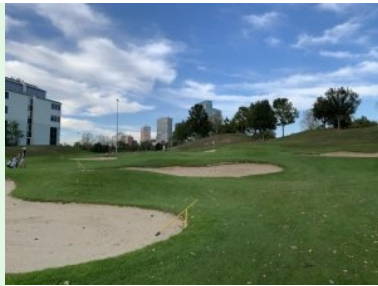
Annäherung Grün Loch 9 (links das Hotel Bosei)