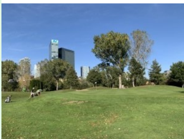
Grün Loch 4