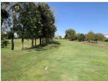
Loch 4 (Par 4, 375m)