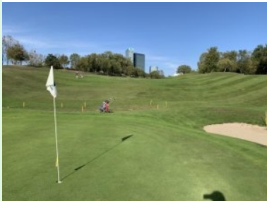
Blick zurück von Grün Loch 3