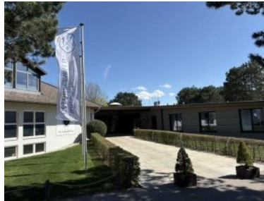
Der Zugang zum Clubhaus des GC Föhrenwald

April 2025 - Die Anlage des GC Föhrenwald liegt vier Kilometer südlich von Wr. Neustadt im Gemeindegebiet von Lanzekirchen . Die Zufahrt erfolgt über die Abfahrt Wr. Neustadt Süd. Das ist die erste Abfahrt, wenn man von der Südautobahn kommend am Knoten Wr. Neustadt auf die Mattersburger Schnellstraße S4 Richtung Mattersburg abbiegt. Von der Abfahrt Wr. Neustadt Süd ist der Golfplatz beschildert. Zuerst geht's auf der Bundesstraße Richtung Süden, dann zweigt man links Richtung Bad Erlach in den Wald ab, dann gleich nochmals links. Das Clubhaus liegt am Ende der Zufahrtsstraße.