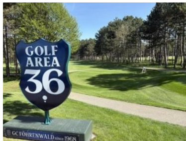
Abschlag Loch 10 (Par 3)

Drivingrange beginnend). Loch 15 (Par 5, 481m von gelb) führt Sie wieder vor zur Halfwaystation im Zentrum des Platzes unweit des Clubhauses. Loch 16 (Par 3, 112m von gelb) ist dann ein kurzes Par 3 mit einem Teeshot über einen Teich. Loch 16 ist zwar nicht typisch für den Platz des GC Föhrenwald, dennoch für mich das Signature Hole. Erwähnen möchte ich auch das Schlussloch, ein Par 5. Das Grün wird links und rechts von Teichen verteidigt, es ist ein würdiges Abschlussloch.