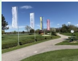
Halfwayhouse, Blick vom Putting Green

Der Championship Platz, der auch zu den "Leading Golf Courses" zählt, war mehrmals Austragungsort der Austrian Ladies Open , die