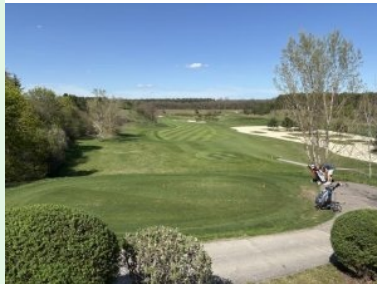
Abschlag Loch 8 (Par 4), rechts die riesige Waste Area

von einer riesigen Waste Area, die jeweils die nach rechts verzogenen Bälle gerne aufnimmt.