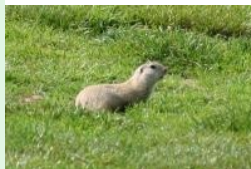
Die scheuen Ziesel tummeln sich auf den Fairways

Zusammenfassend ist die Anlage des GC Föhrenwald sehr zu empfehlen. Verkehrstechnisch über die Südautobahn günstig zu erreichen (50 km südlich von Wien) spielt sich der von Föhrenwald umgebenen Championship Platz sehr schön. Die Übungs-Infrastruktur ist sehr gut, das Clubrestaurant klein aber fein.