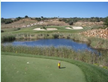
Loch 11 (Par 3, 115m)