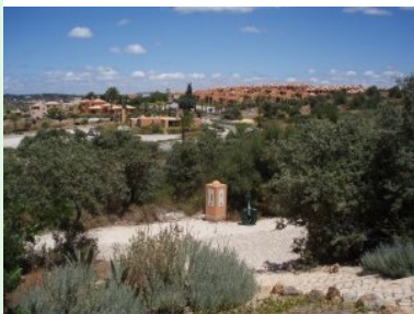
Blick auf die Immobilien des Amendoeira Resorts