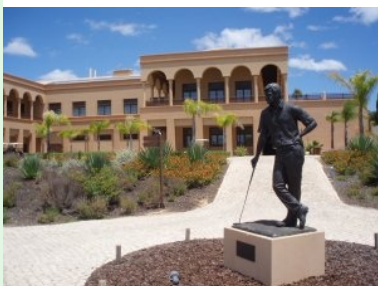
Skulptur von Nick Faldo