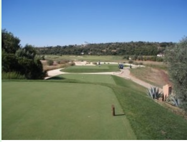
Abschlag Loch 8 (Par 4, 335m)