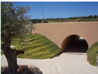
Der Tunnel unter der Straße