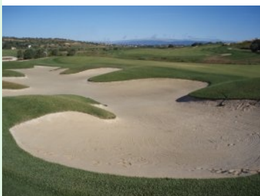
Grünbunker auf Loch 4