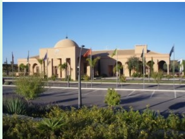
Das Clubhaus des Amendoeira Golf Resorts

Grüns sind unglaublich schnell, teilweise fast schon nies onduliert und ausnahmslos durch Bunker verteidigt.