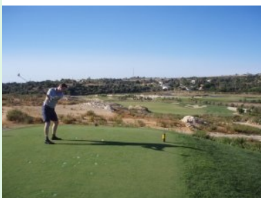
Abschlag Loch 4 (Par 5, 478m)