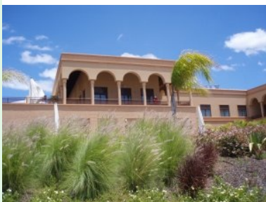
Zurück im Clubhaus