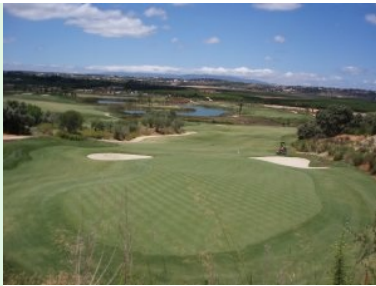
Blick vom Clubhaus hinunter auf Grün 18

das Fairway liegt im Tal und führt entlang der Straße zurück zum Tunnel, der die Straße unterfährt. Loch 18 (Par 5, 433m) führt ganz leicht bergauf zum Grün das direkt unterhalb des Clubhauses liegt. Ein Teil des Platzes für das Grün wurde aus dem Felsen rausgesprengt sodass das Grün wie in einem halbkreisförmigen Amphitheater liegt - ein würdiger Abschluss einer hochinteressanten Runde Golf auf einem dramatischen, atemberaubenden und fantastischen Golfplatz!