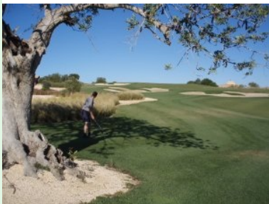
Im Knie von Loch 3