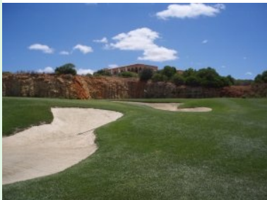
Grün Loch 18; wie ein Amphitheater aus dem Felsen gesprengt