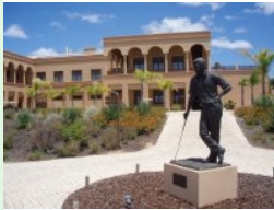
Skulptur von Nick Faldo

Die Algarve ist die südlichste Region Portugals. Neben den wunderschönen Stränden sind es vor allem die Golfplätze die die Touristen anlocken. Einer der neuen Top-Golfplätze ist der Faldo Course des Amendoeira Golf Resorts , der Platz wurde im Herbst 2008 eröffnet. Der Golfplatz erstreckt sich über beide Seiten (Hänge) eines Tales und ist nicht nur golferisch herausfordernd sondern vor allem ungewöhnlich schön und spektakulär. Alle Löcher haben fünf Teeboxen, die geschwungene Fairways und Bunker sind ebenso typisch für den Platz wie die spektakulären Teeshots und die durchwegs höher liegenden Grüns. Viele Sandbunker und jede Menge Teiche machen den Platz für das Auge wunderschön und für das Golfen sehr herausfordernd.