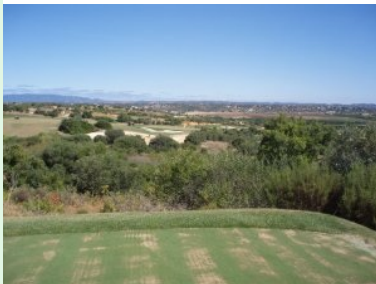
Abschlag Loch 13 (Par 5, 521m) über den Graben