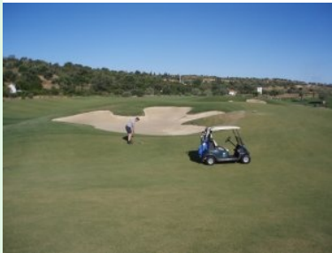
Grün Loch 5