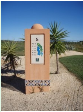
Infotafel am Tee 5