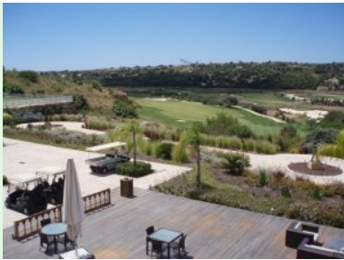
Blick vom Clubhaus hinunter auf die Terrasse