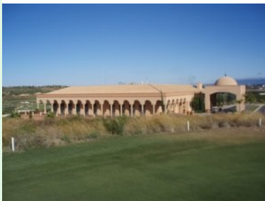
Blick von Grün 3 hinunter zum Clubhaus