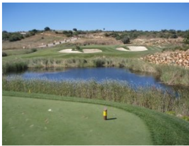
Loch 11 (Par 3, 115m)