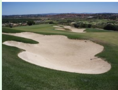
Loch 13 (Par 5, 521m); am Gegenhang die Immobilien

Fairway, dass auf Höhe der Landezone des zweiten Schläges von einem ausgetrockneten Bachbett/Waste Area im rechten Winkel gequert wird. Die nun folgenden Löcher 7 bis 10 liegen alle im Bereich vor und unterhalb des Clubhauses. Loch 7 (Par 3, 181m) ist ein langes Par 3 dessen Grün links und rechts von zwei Bunkern verteidigt wird, der rechts ist riesengroß mit vielen Verästelungen. Loch 8 (Par 4, 335m) ist formal das schwerste Loch am Platz (Index = 1). Die Teeboxen liegen terrassenförmig leicht erhöht am Hang, das Loch ist ein Dogleg nach links. Übrigens: Die riesige Wasserrutsche am Horizont des Gegenhangs auf der anderen Seite des Tals, neben der Algarve Autobahn, gehört zum Aqualand Algarve, auch The Big One genannt. Die Kamikaze Rutsche ist 36m hoch und 95m lang, in vier Sekunden rutschen dort erlebnishungrige Besucher in die Tiefe. Der Teeshot von Loch 9 (Par 4, 325m) führt über eine Waste Area auf ein leicht ansteigendes Fairway. Das Grün liegt ebenfalls leicht erhöht direkt unterhalb des Clubhauses.