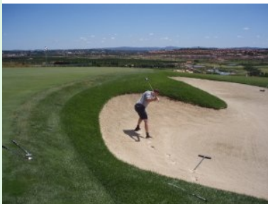
Grün Loch 15 (Par 4, 303m)