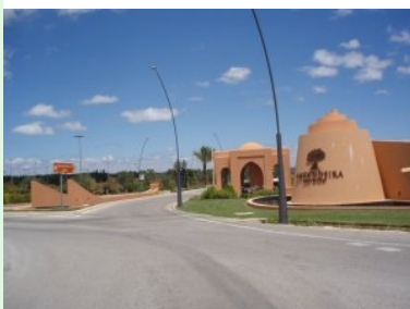
Die Zufahrt: Das Pfortnerhaus des Amendoeira Resorts