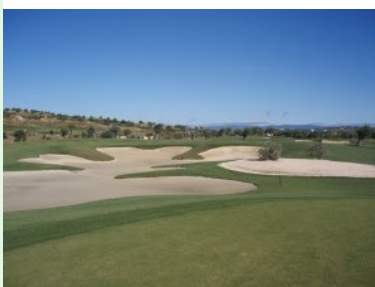
Grünbunker auf Loch 6