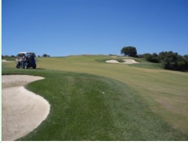
Fairway Loch 12