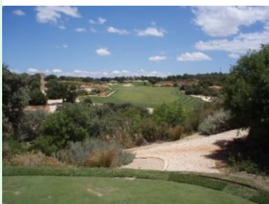
Abschlag Loch 1 (Par 4, 388m)