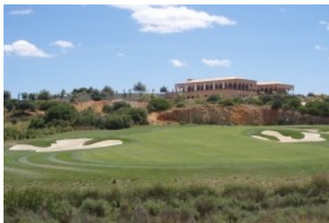
Amphitheater Grün Loch 18 (Par 5, 433m)

anderen Talseite. Die Löcher 10 und 18 liegen parallel zu einander unterhalb des Clubhauses. Die Teeboxen von Loch 10 (Par 4, 433m) liegen wieder - typisch für den Faldo Course - terrassenförmig und leicht erhöht am Hang unterhalb des Clubhauses. Auch hier können Sie wieder aus dem Vollen schöpfen und Ihren Driver auspacken. Wieder erschweren mehrere ausgeprägte Fairwaybunker und eine Waste Area das zügige Vorankommen. Zwischen dem Grün von Loch 10 und dem Tee von Loch 11 geht es durch einen kleinen Tunnel unter der Straße, die entlang des Tales führt, durch. Die nun folgenden Löcher 11 bis 17 liegen auf der