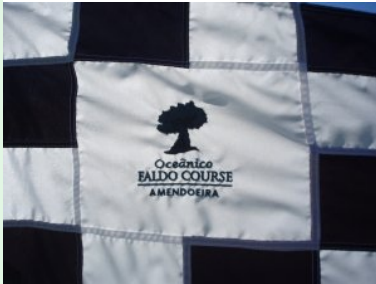
Oceanico Faldo Logo in der Fahne