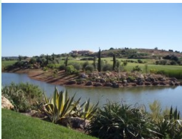
Blick von Tee 6 hinauf zum Clubhaus