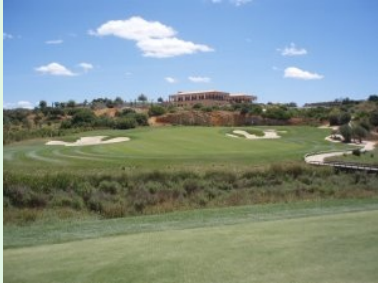
Annäherung Grün Loch 18 (Par 5, 433m)