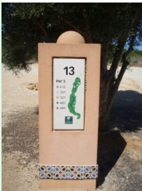
Infotafel an Tee 13