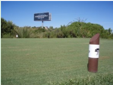
Eine Werbetafel für das Amendoeira Resort an der Algarve-Autobahn