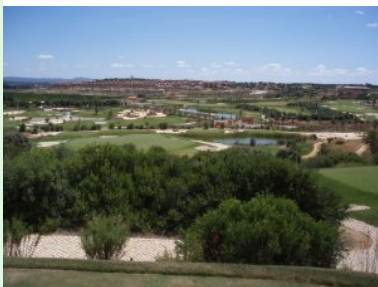
Loch 16 (Par 3, 112m)