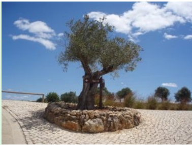
Am Weg zu Tee 18