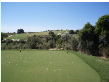
Abschlag Loch 12 (Par 4, 299m) über den Graben