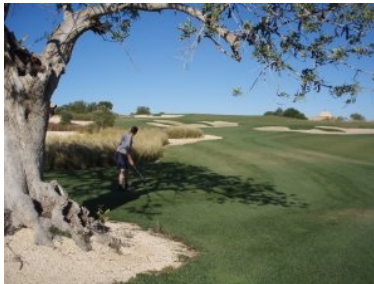
Loch 3 (Par 4, 310m)

Schon von der Zufahrtsstraße im Tal sieht man das gewaltige Clubhaus das am Hügel steht und quasi über der Anlage thront, etwas weiter hinten im Tal stehen viele neue in rötlichen Pastelltönen gestrichenen Häuser, Reihenhäuser und Appartements, die ebenfalls zur Anlage gehören. Lee Westwood und Darren Clarke sind nur zwei Profis, die hier bereits ein Eigenheim gekauft haben. Ob sich die Immobilien in Zeiten der globalen Wirtschaftskrise außer den Golfpros noch jemand leisten kann ist eine andere Frage. Die Zufahrt zum Resort ("gated community") erfolgt über ein elegantes Pförtnerhaus (im Stil passend zu allen anderen Immobilien der Anlage inklusive dem Clubhaus, der Golfschule und der Halfway-Station). Gleich nach der Einfahrt geht es über eine Brücke, die ein ausgetrocknetes Flussbett überspannt, hinauf zum gewaltigen Clubhaus. Neben dem Clubhaus gibt es bei der Driving Range noch ein eigenes Gebäude für die Academy das in etwa die Dimensionen eines durchschnittlichen Clubhauses in Mitteleuropa hat.