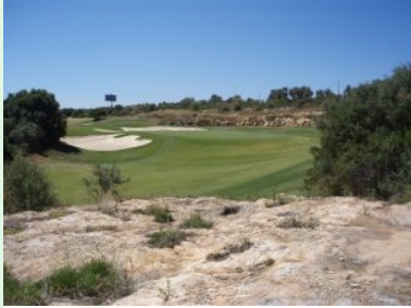
Loch 14 (Par 4, 327m)