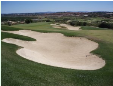
Fairway- und Grünbunker auf Loch 13