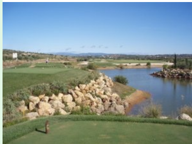
Loch 6 (Par 5, 489m)

Gegenhang. Man spielt teilweise über riesige Gräben auf schräge Landezonen, durch mediterrane Vegetation. Alle Spielbahnen haben 5 Teeboxen (die Championship-Tees haben die Farbe Gold), die meisten davon baulich voneinander getrennt. Hut ab vor Nick Faldo, der Platz ist mit das Beste was ich bisher gesehen und gespielt habe. Nick Faldo lobt naturgemäß auch seinen Platz an der Algarve: "Der Platz hat sich toll entwickelt, er ist schnell erwachsen geworden, er hat das Zeug ein perfektes Beispiel für einen mediterranen Wüstenkurs in Europa zu werden. Das Projekt gab mir die Möglichkeit, ein sehr strategisches Design zu entwickeln und ich denke, dass der Platz für viel Aufmerksamkeit an der Algarve sorgen wird."