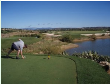
Abschlag Loch 6 (Par 5, 489m)