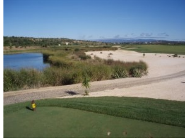
Abschlag Loch 5 (Par 4, 309m)