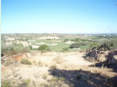
Abschlag Loch 3 (Par 4, 310m) über einen Graben