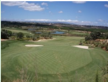
Blick vom Clubhaus zurück auf Loch 18