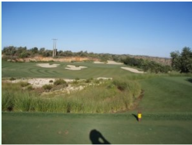
Loch 2 (Par 3, 147m)