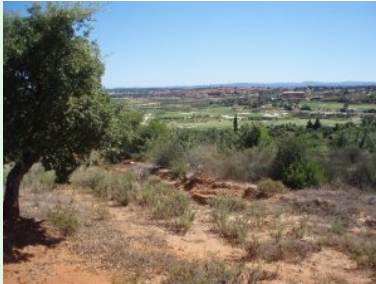
Blick auf die andere Talseite mit Clubhaus und Immobilien