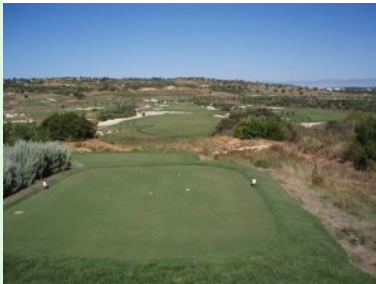
Abschlag Loch 10 (Par 5, 433m)