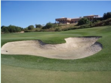
Grün Loch 9 (Par 4, 325m)