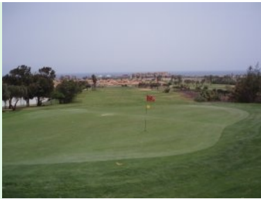
Blick hinunter von Grün Loch 17 (Par 5, 440m)

geht's mit Loch 2 (Par 4, 406m) auf Grund der Länge schon ordentlich zur Sache. Danach geht's über eine Straße weiter zu Loch 3 (Par 4, 355m). Loch 4 (Par 3, 154m) bringt sie schließlich an das östliche Ende des Golfplatzes, das Grün liegt direkt neben dem McDonalds Restaurant. Loch 6 und 7 liegen an einem Teich, wobei bei Loch 7 (Par 3, 158m) das Wasser gefährlich nahe an Fairway und Grün kommt. Die Löcher 8 und 9 schlängeln sich um die Driving Range zurück zum Clubhaus/Hotel.