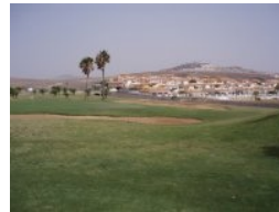
Grün Loch 1 (Par 4, 315m)

rund 30 Grad Celsius, der fast ständig wehende Wind macht die Temperatur im Sommer noch angenehmer, allerdings wird das Golfspielen schwieriger. E-Carts - sie heißen hier Buggys - sind trotzdem empfehlenswert, so können sie sich voll auf ihr Golfspiel konzentrieren. Regen ist auf der trockenen Insel eine Seltenheit.