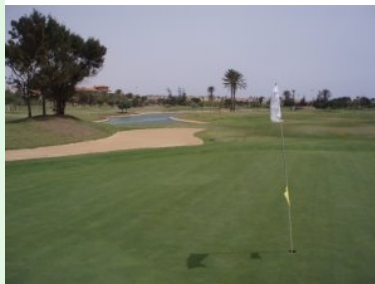
Grün Loch 6 (Par 4, 347m), hinten das Hotel

Von Norden kommend erreichen sie den Golfplatz des Fuerteventura GC indem sie beim Kreisverkehr mit der Golfer-Statue direkt im Zentrum von Caleta de Fustes (beim McDonalds Restaurant) rechts abbiegen, ab da folgen sie bitte den Hinweisschildern "Elba Palace Golf", der Zugang zum Golfplatz erfolgt nämlich über das Elba Palace Golf Hotel . Das Hotel liegt auf der hinteren, etwas höher gelegenen Seite des Golfplatzes. Um ins Sekretariat zu gelangen müssen sie nicht durch das noble Fünfsterne-Hotel. Sie können außen herum gehen, seitlich gibt es einen einen Eingang zum Sekretariat des Fuerteventura Golf Clubs . Die Dame im Sekretariat stammt aus Deutschland und spricht deshalb perfekt deutsch.