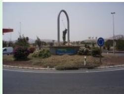
Kreisverkehr bei der Zufahrt mit Golferstatue

Die Temperaturen in Fuerteventura sind ganzjährig golftauglich. Sogar im Hochsommer hat es nicht mehr als