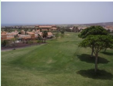
Blick von Tee 18 über die Anlage; in der Mitte hinten das Hotel

Der Platz des Fuerteventura Golf Clubs ist der älteste 18-Loch Golfplatz auf Fuerteventura. Das Clubhaus ist in einem Fünf-Sterne-Hotel untergebracht. Der Pflegezustand des Platzes und das Design entsprechen mitteleuropäischem Niveau. Bis auf die letzten beiden Löcher ist der Platz flach und durch die Lage nahe am Meer meistens windig. Die Palmen entlang der Fairways und die vielen Premium-Immobilien, die den Golfplatz säumen, ergeben ein tolles Flair, das sie sich als Fuerteventura Urlauber nicht entgehen lassen sollten. Die Greenfee des Par 70 Kurses liegt übrigens im Sommer bei EUR 55, was für den Platz durchaus sehr attraktiv ist (im Winter beträgt die Greenfee EUR 70.-), EUR 25.- kostet der Buggy.