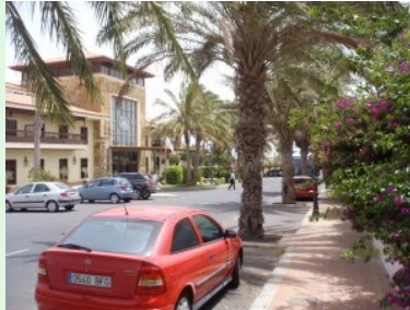
Das 5-Sterne Hotel Elba Palace Golf beherbergt die Clubräumlichkeiten des Fuerteventura GC

Der älteste Golfkurs auf der kanarischen Insel Fuerteventura