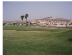
Grün Loch 1 (Par 4, 315m)

rund 30 Grad Celsius, der fast ständig wehende Wind macht die Temperatur im Sommer noch angenehmer, allerdings wird das Golfspielen schwieriger. E-Carts - sie heißen hier Buggys - sind trotzdem empfehlenswert, so können sie sich voll auf ihr Golfspiel konzentrieren. Regen ist auf der trockenen Insel eine Seltenheit.