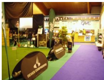
Der Eingangsbereich mit dem Putting Green

kann ist verständlich. Was diesmal aber in der Golfhalle nicht OK war, war die Einstellung des Personals. Zu Beginn wurde vergessen das Licht im Simulator aufzudrehen (obwohl ich am Weg zum Simulator extra gemeldet habe, dass wir jetzt starten). Dann gab es weder Tees noch Bälle in der Box - diese mussten wir extra holen. Getränkeservice gibt es in der Golfhalle leider nicht, obwohl ich der Meinung bin, dass man gerade mit Red Bull & Co ein schönes Zubrot verdienen kann. Es ist halt ein Unterschied ob ich während einer Golfrunde am Simulator nur ein Getränk konsumiere (weil ich es mir selber holen muss) oder ob es drei bis vier Getränke pro Runde sind, wenn das aufmerksame Personal immer wieder mal vorbeischaut.