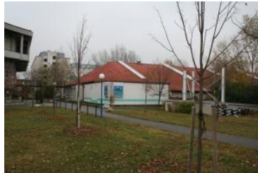
Golfhalle (rechts) und Budocenter (links)

Direkt neben dem riesigen pavillon-förmigen Betonklotz des Budocenters befindet sich ostseitig die Golfhalle.