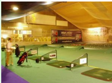
Die Abschlagplätze in der Golfhalle

Die Golfhalle ist insofern einzigartig unter den Wiener Indoor Golf Locations, als dass sie neben den drei Golfsimulatoren auch die Möglichkeit einer Indoor Drivingrange bietet.