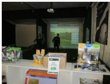
Indoorgolf umgeben von Outletware

Die Simulatorsoftware ist - wie auch bei anderen Indoorgolf Anlagen - nicht mackellos. Übereinstimmend mit meinem Flightpartner - immerhin der amtierende Clubmeister vom Golfclub Drosendorf - sind die Distanzen der langen Schläge zu kurz und die der kurzen Schläge zu lang. Das ist schade - es dauert einige Löcher bis man sich daran gewöhnt, man muss halt mit "mehr oder weniger Schläger" kompensieren. Die Software hat auch kleinere Probleme bei der Reihenfolge der Spieler - diese entspricht nicht immer den im Golf üblichen Gepflogenheiten. Wie auch bei anderen Indoorgolf Anlagen kommt es in der Anlage in Stockerau vor dass zwischendurch ein (Annäherungs-) Schlag vom (Radar-)System nicht erkannt wird und man den Golfschlag wiederholen muss. Was mir noch aufgefallen ist ist die Tatsache dass die graphische Darstellung des Golfschwungs aus der Sicht von oben ("Überkopfkamera") leider nur im Drivingrange-Modus nicht aber auf der Runde am Platz möglich ist. Das ist mir unverständlich weil ich ja auch während der Runde die Möglichkeit des Feedbacks haben möchte um mich zu verbessern.