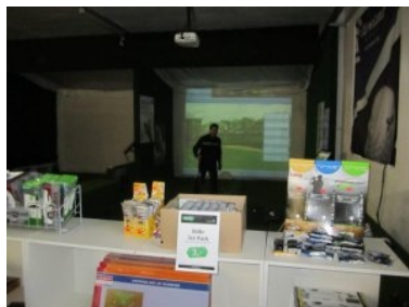
Indoorgolf umgeben von Outletware

Die Simulatorsoftware ist - wie auch bei anderen Indoorgolf Anlagen - nicht mackellos. Übereinstimmend mit meinem Flightpartner - immerhin der amtierende Clubmeister vom Golfclub Drosendorf - sind die Distanzen der langen Schläge zu kurz und die der kurzen Schläge zu lang. Das ist schade - es dauert einige Löcher bis man sich daran gewöhnt, man muss halt mit "mehr oder weniger Schläger" kompensieren. Die Software hat auch kleinere Probleme bei der Reihenfolge der Spieler - diese entspricht nicht immer den im Golf üblichen Gepflogenheiten. Wie auch bei anderen Indoorgolf Anlagen kommt es in der Anlage in Stockerau vor dass zwischendurch ein (Annäherungs-) Schlag vom (Radar-)System nicht erkannt wird und man den Golfschlag wiederholen muss. Was mir noch aufgefallen ist ist die Tatsache dass die graphische Darstellung des Golfschwungs aus der Sicht von oben ("Überkopfkamera") leider nur im Drivingrange-Modus nicht aber auf der Runde am Platz möglich ist. Das ist mir unverständlich weil ich ja auch während der Runde die Möglichkeit des Feedbacks haben möchte um mich zu verbessern.