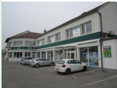
Der Golf Star Shop in Stockerau

Das Einchecken erfolgt im Golf Star Shop vorne, die Golfsimulatoren befinden sich in einem eigenen Gebäude hinten im Hof in dem auch der Outlet Shop untergebracht ist. Man geht durch den Hinterausgang des vorderen Shops - da befinden sich auch die WC Anlagen - in den Hof, überquert diesen und geht dann in die Halle hinten im Hof.