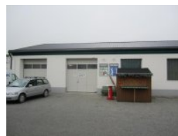
Der Eingang zur Outlet-Halle

Das Einchecken erfolgt im Golf Star Shop vorne, die Golfsimulatoren befinden sich in